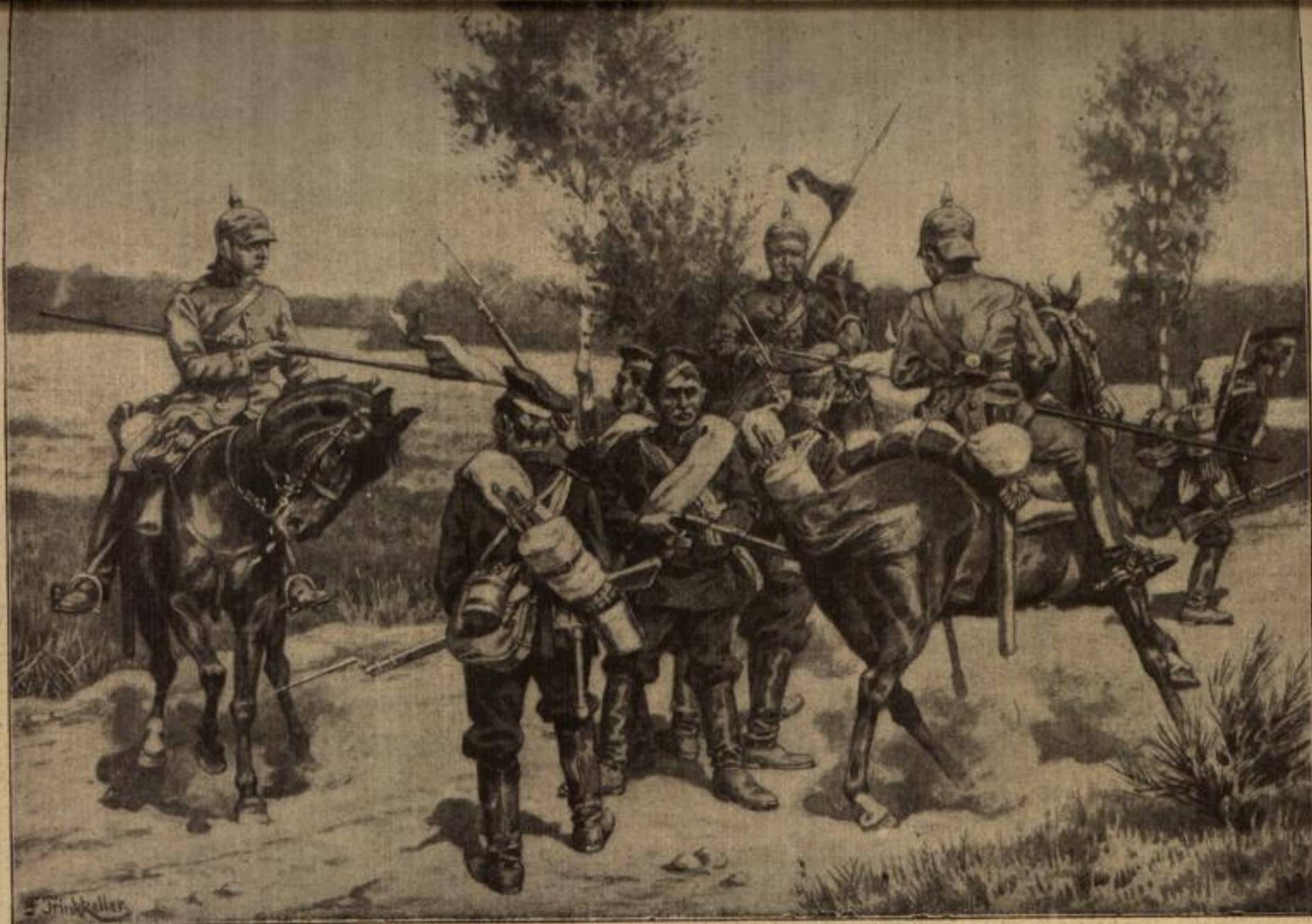
Gefangennahme einer russischen Patrouille durch ostpreussische Kürassiere. Originalzeichnung von J. Trinkeller.