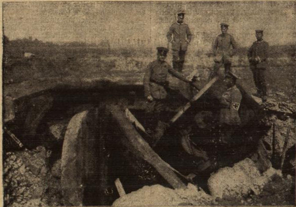
Zerschossener Panzerturm des Forts Loucin bei Lüttich. (Mit Text.)

„Bete für mich, mein liebes Mädchen, daß ich heil wieder komme“, flüsterte Schrader dem Kinde zu — „und für die Mütterchen, daß es bald wieder gesund wird.“