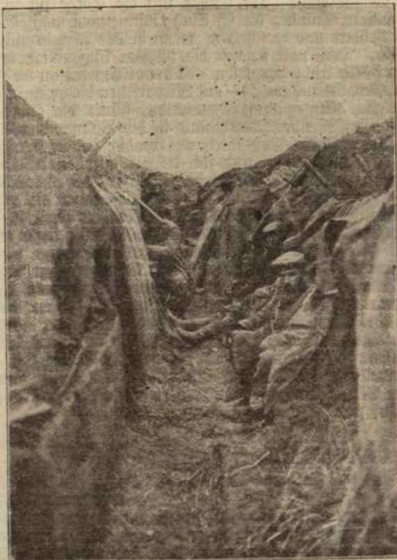
Das Leben in den vordersten Schützengräben. Rechts Schlafhöhlen und Sitzgelegenheiten, links Postkränze, die als Tisch und Schrank dienen.