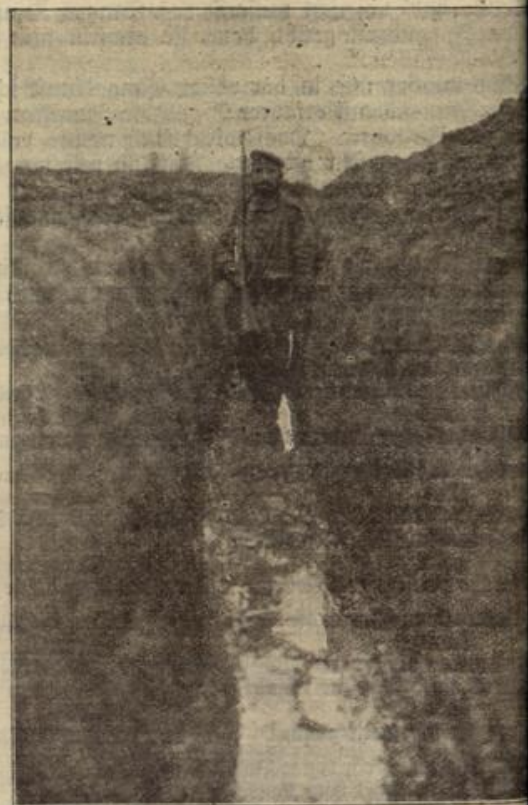
Verbindungsgraben zum Befördern von Munition Nahrungsmitteln nach den vordersten Schützengräben.