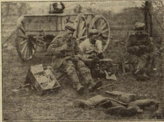
Der Regimentschustler bei der Arbeit. Nachdem die Zeit der langen Märsche vorüber ist, geht „das Geschäft“ etwas ruhiger.

Hinter dem Gros der Truppen, in einer Tal-senkung, vollständig unsichtbar gemacht, steht das Zelt des Armeeführers, umringt von einer ganzen Anzahl kleinerer und größerer dieser lustigen Behau-