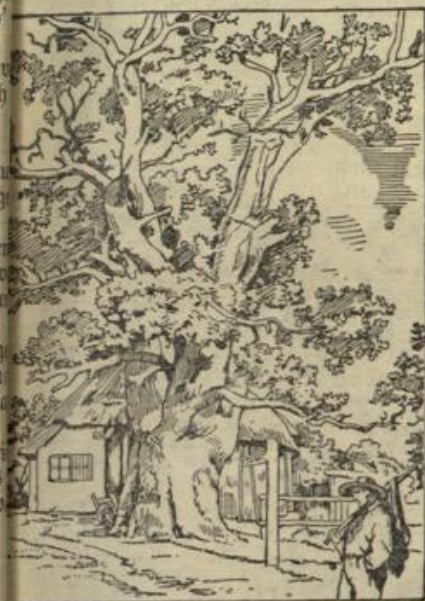
Wo ist der Gefährte?

Dreihundertfünfzig Meter — jetzt! Ein gel- lender Pfiff, ein auf- zuckendes Feuermeer, ein rasender Schlag. Und nun ein Rattern und ein Prasseln, ein Schmettern und Kra- chen, als ob die Erde bersten wolle. Die er- sten Reihen der heran- saufenden Schwadronen liegen wie hingemäht. Darüber, rechts und links vorbei, stürzt der Nest. Nur ein fürchter- licher Wall von zuden- den, stürzenden Men- schen und Tieren, ein gräßliches Durcheinan- der von Waffen, bäu- menden, springenden Pferden ist noch zu sehen, aus dem gellen- des Wiehern, schauer- liches Röcheln, Todes- schreie von Mensch und