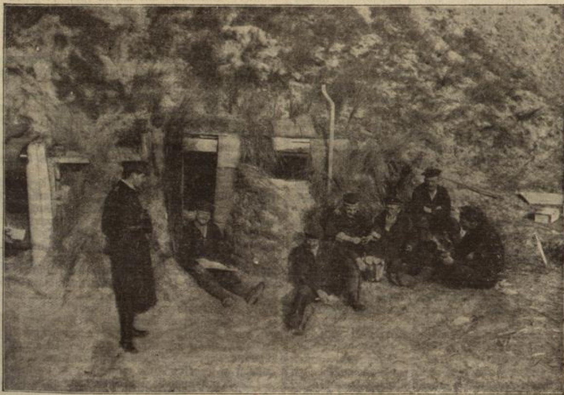
Schuhhütte deutscher Matrosen in den Dünen bei Ostende.

„Treu war die Amme nie!“ entgegnete der Köhler. „In ihrer Herzensgüte hat Frau Fiebrand, Eure edle Mutter, zu fest auf sie gebaut! — Wenn mich nicht alles trügt, dann hat die Friedegund auf Geheiß des wüsten Hans von Rosenstein