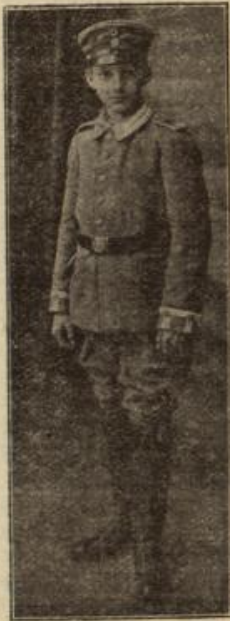
Der jüngste Unteroffizier der deutschen Armee. (Mit Text.)

Selbst der Mond, der gestern noch so rein und hell den langen Marschkolonnen leuchtete, scheint den kühnen Deutschen helfen zu wollen. Andauernd verbirgt er sein strahlendes Antlitz hinter den düster und schwer über die un-