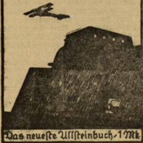
Das neueste Allsteinbuch, 1 Mk.