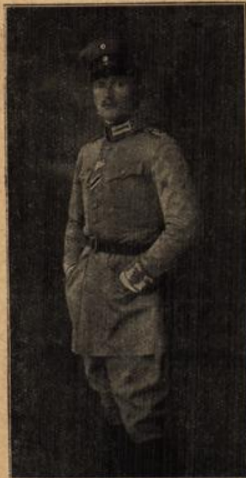
Rittmeister Prinz Heinrich von Bayern. (Mit Text.)

In den steilen Tälern wird die Post auf Eseln befördert.