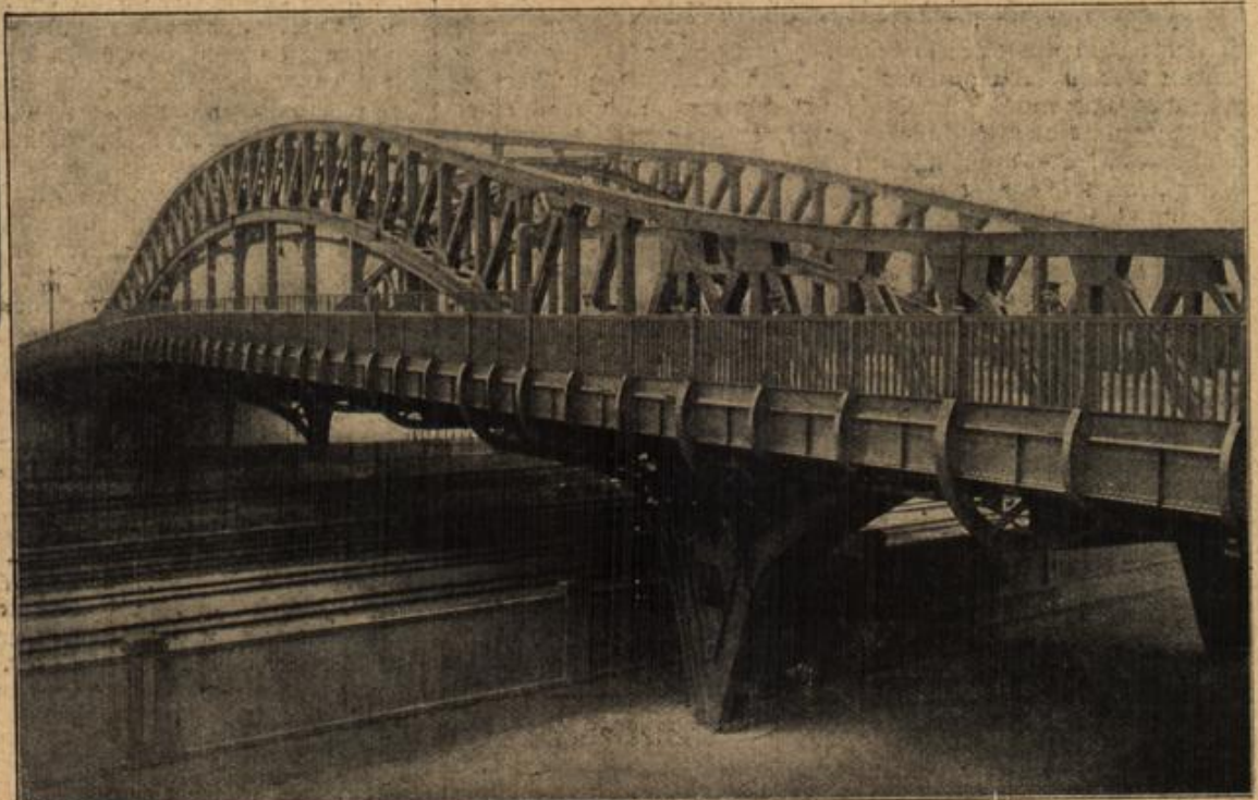
Die Hindenburg-Brücke in Berlin. (Mit Text.)

Auch der alte Herr war neubeu noch tätig. Schwer brückte ihn der nahende Abschied von dem einzigen Sohn, der morgen an der Front ein-treffen mußte.