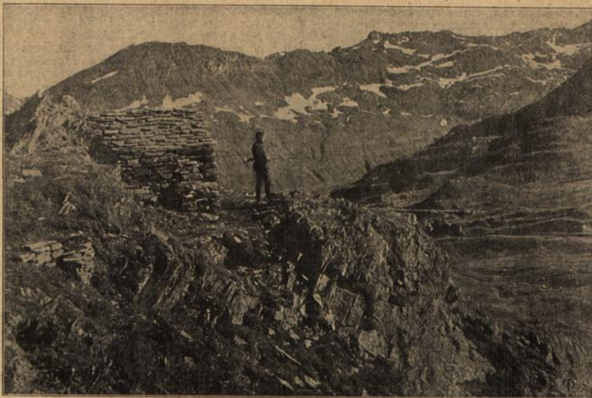
Die bewaffnete Neutralität der Schweiz: Ein schweizerischer Wachtposten im Splügengebiet.

Nur fünf Stunden waren vergangen, seit dem Nichtsahnenden seine Aertertüre sich öffnete zur goldenen Freiheit.