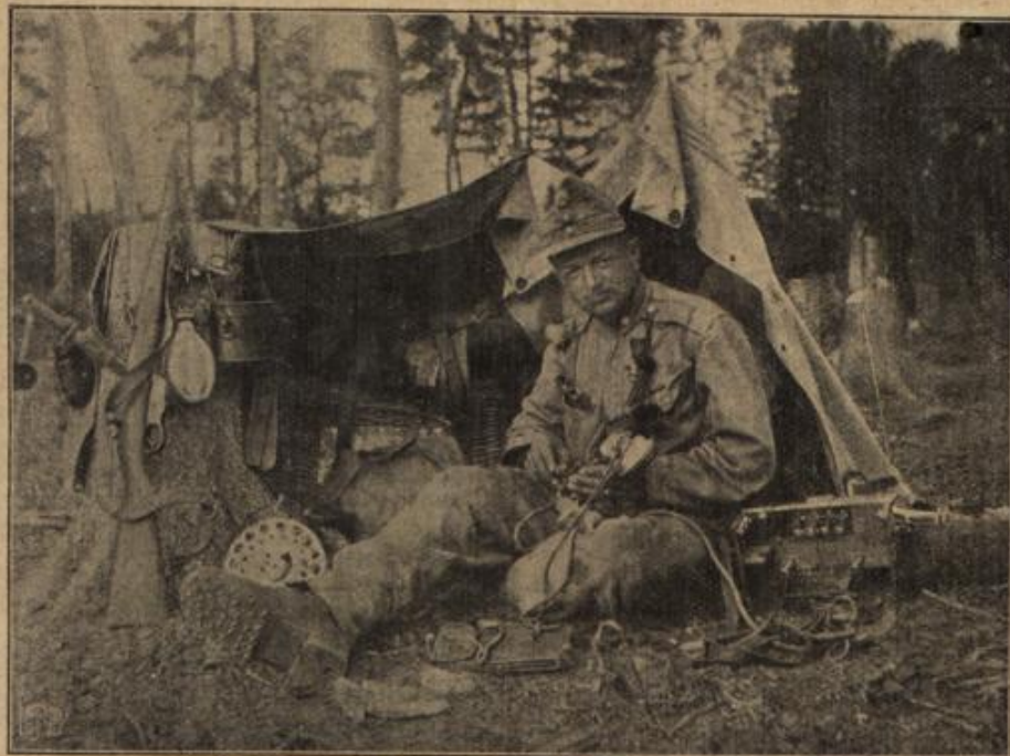
Österreichische Telephonzelle im Walde vor Pinsk. Der dienstkundige Soldat ist beim Prüfen der Telephonleitungen.

Die Hindenburg-Brücke in Berlin . Ungehindert durch den Krieg gehen in deutschen Landen zahlreiche große Schöpfungen ihrer Vollendung entgegen. Von den Hoch- und Tiefbauten Berlins wurde in diesen Tagen die neue Hindenburg-Brücke eingeweiht. Die dritte „Millionenbrücke“ in Berlin liegt im Zuge der Bornholmer Straße, führt über das riesige Eisenbahnhoch der Stettiner Bahn und hat mit Erlaubnis des Generalfeldmarschalls von Hindenburg dessen Namen erhalten.