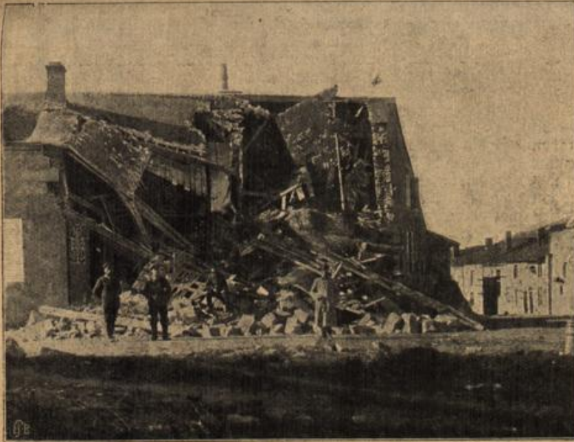
Eine Häuserreihe aus Briantes in der Champagne, an welcher die Wirkungen einiger Vulkantreffer zu sehen sind.

Manfred dem Alten von Marias Vorzügen vorgegeschwärmt, war aber ganz eifrig abgehauen worden.