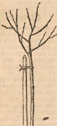
Abbild. 3. Richtig abgeflanteter Baumpfahl.