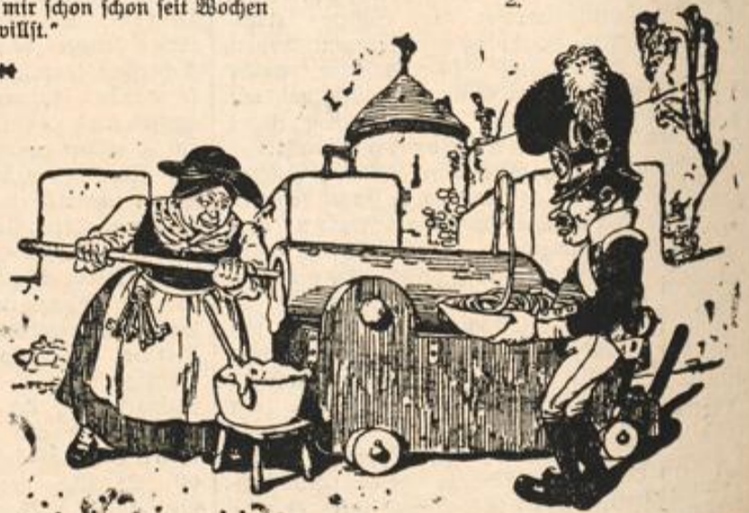
„Na, heit geht's net, die Frau Kontinentolettin brauchts puer Nudel machen!“