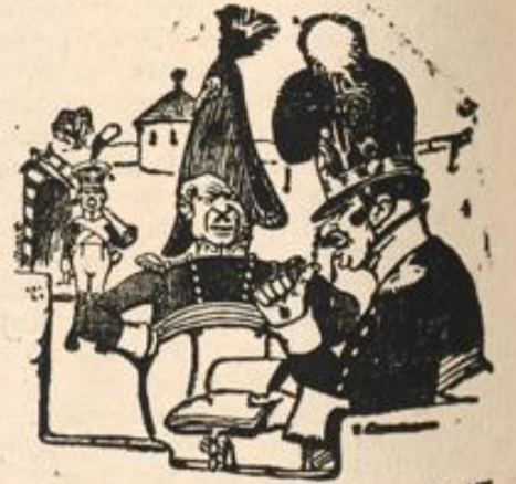
„Warum üben wir heut net am Geschütz?“