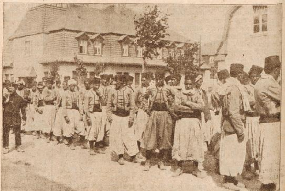
Französische Kolonialtruppen in dem deutschen Gefangenenlager in Ohrdruf i. Th.

Ich sann einen Augenblick nach, tief ergriffen von seinen