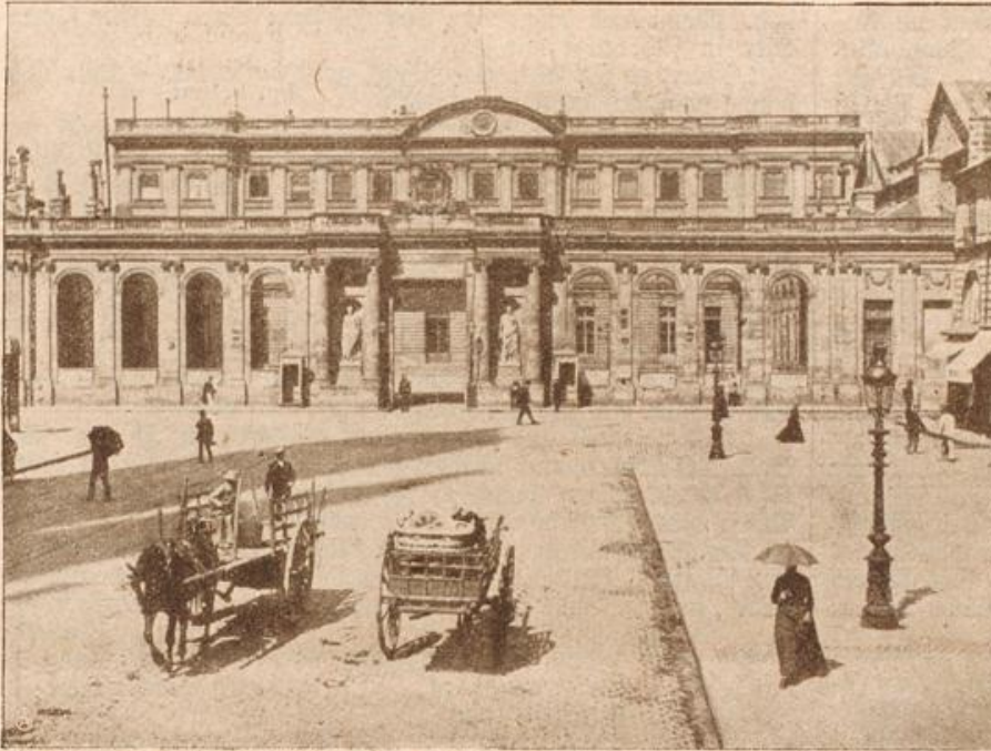
Vertagung der franz. Regierung nach Bourdeaux: Sitz des Ministerpräsidenten Viviani.

Schneefoppe bis zum Reifträger, sah alle die kühlen, grünen Gründe und Täler, hörte die Quellen murmeln und die Wälder rauschen, und kam nicht los aus dem Bann und dem Zauber der Heimat. Und wen, der in der Fremde — im „Eland“, wie unsere Vorfahren so bezeichnend sagten — weilen muß, dieser Zauber erst einmal hat, den läßt er nimmer los.