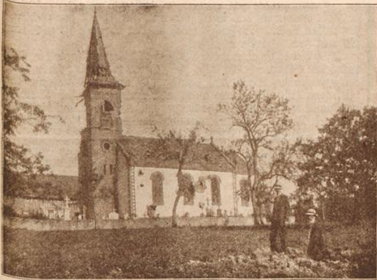
Die Kirche im Dorf Schneckenbusch bei Saarburg. (Mit Text.)

letzten Worten, die mich einen Blick in ein stürmisches Mannesherz hatten tun lassen. „Man wird die Aufhebung der amtlichen Lebensklärung, die offenbar seitens der hiesigen Behörden auf