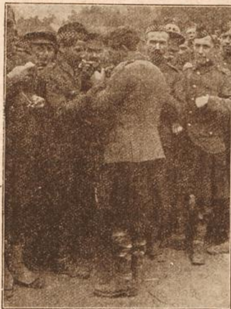
Englische Gefangene in Döberitz.

Schneefoppe bis zum Reifträger, sah alle die kühlen, grünen Gründe und Täler, hörte die Quellen murmeln und die Wälder rauschen, und kam nicht los aus dem Bann und dem Zauber der Heimat. Und wen, der in der Fremde — im „Eland“, wie unsere Vorfahren so bezeichnend sagten — weilen muß, dieser Zauber erst einmal hat, den läßt er nimmer los.