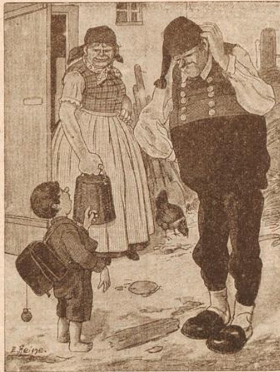
Fatales Tag. Sohn: „Bata, heut hat mi der Lehra g'lobt!“ Vater: „Dds is recht, was hat er denn g'sagt?“ Sohn: „Er hat g'lagt: Wazi bu g'fallst ma, du bist ja noch dümmmer wie bei Bata!“

Was tut man mit den Hasenfellen? Diese Frage mag manche Hausfrau stellen, wenn sie Meister Lampe das Fell abzieht, das doch so hübsch mollig und weich ist und trotzdem meist achlos weggegeben wird, weil man keine rechte Verwendung dafür hat. Man kann aber ohne viel Mühe das Hasenfell selbst präparieren und dann allerhand nützliche Gegenstände daraus fertigen. Zum Beispiel gibt das Fellchen ein sehr warmhaltendes Futter für Futstaschen, auch Bettfußtaschen, ebenfalls für Kindermuffen und Hausschuhe. Ganz vortreffliche Dienste leistet es aber, wenn man es für Einlegefohlen verarbeitet, die für Wagen- und Schlittensfahrten und für den Wintersport sehr angenehm sind und warme Füße erhalten. Das Präparieren des Felles geschieht auf folgende, sehr einfache Weise.