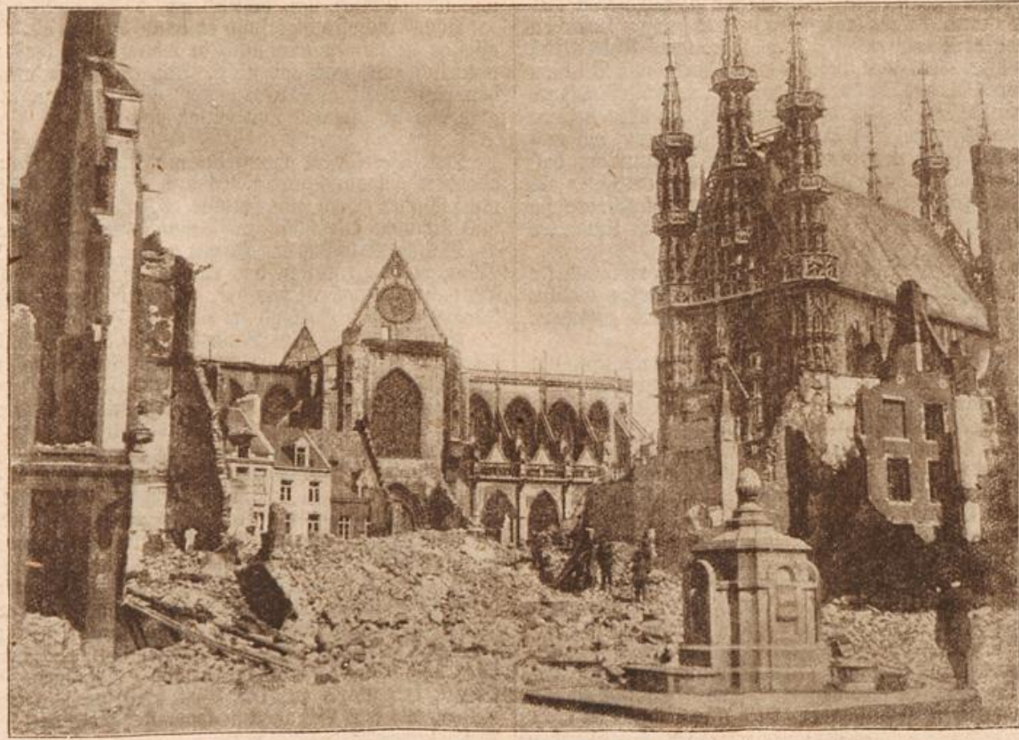
Das berühmte Rathaus und die Kathedrale von Löwen. (Mit Text.)

dem neuen Hausgenossen herzlich eine gute Nacht gewünscht hatte, ihn bedauernd, daß er trotz der anstrengenden, langwierigen Bahnfahrt noch nicht früher zu Bett gedurft, da war es Ulrich in seinem trauten, sauberen, mit Blumen geschmückten Zimmer, als lächelnd ihm freundliche Gesichter aus allen Ecken und Winkeln entgegen, als raunte die alte Linde, deren Zweige ganz leise ans Fenster tippten, ihm