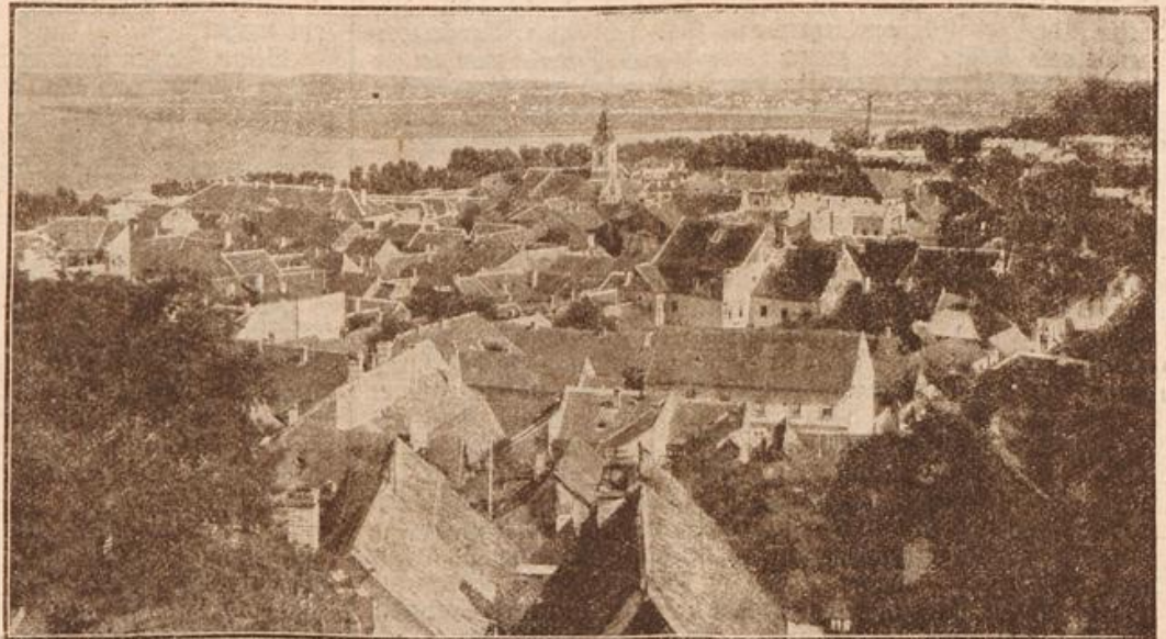
Ansicht von Semlin. (Mit Text.)

Ich kam nach Versailles, sah den neuen Kaiser und seine Palastne, erneuerte im Hotel des Reservoirs, dem großen Treffpunkt der höheren deutschen Offiziere, alte Bekanntschaften und knüpfte neue an und reiste endlich nach Le Mans weiter, wo mir ein Neffe an einer Verwundung darniederlag. Ich traf ihn schon wieder bei gutem Wohlbefinden und konnte seiner