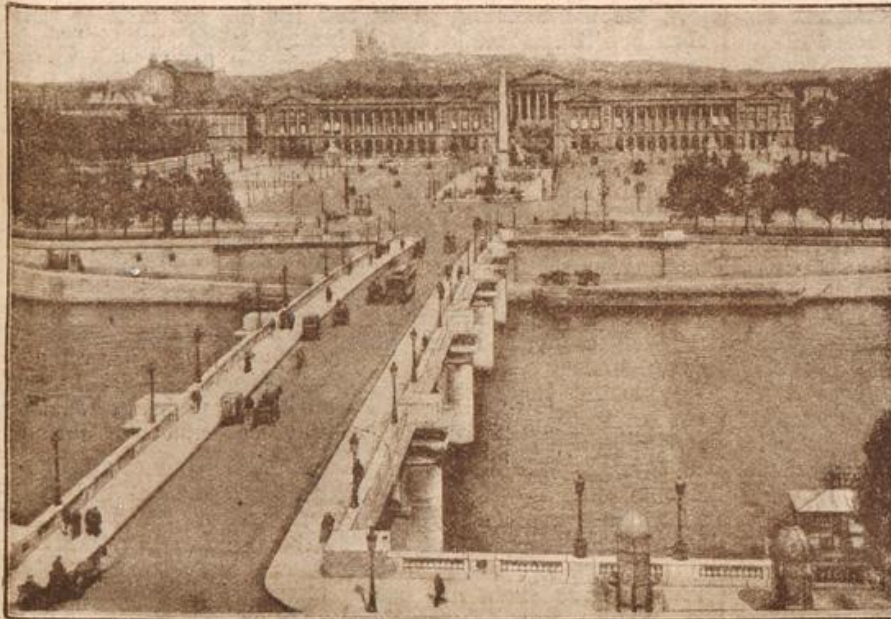
Aus Paris: Die Place de la Concorde mit dem Obelisk von Luxor. (Mit Text.)

letzten Worten, die mich einen Blick in ein stürmisches Mannesherz hatten tun lassen. „Man wird die Aufhebung der amtlichen Lebensklärung, die offenbar seitens der hiesigen Behörden auf