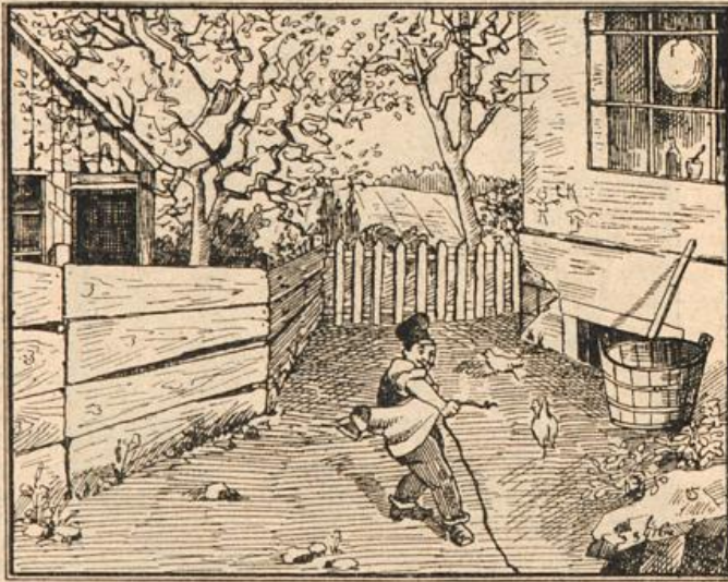
Wo ist das Schwein?

Arbeiterin ihrer Art zur Gesellschaft. Als diese krank im Sterben lag, konnten sich die Königinnen gar nicht im Betasten, Streicheln und Beleden. Besonders rüh- te eine Königin, die selbst einen Fühler eingebüßt hatte, Pflege und Besorgung. Aber auch die sterbende Arbeiterin in ihren letzten Augenblicken daran, daß etwas Seelen- im niederen Tier lebt. Sie lag zuletzt auf der rechten und hob nur ab und zu das linke Hinterbein in die Höhe. und sie streichelten, die immer um die Sterbende herum- schen im letzten Ausfludern des Lebens zitternd, wie über dankend, den Fühler nach den Pflegerinnen hin. den geschilderten Beobachtungen dürfte hervorgehen, daß gemessen keineswegs als in ihrem etwas einseitigen Staats- völlig verküchert zu betrachten haben, sondern daß einer Art „persönlicher“ Freundschaftsempfindung, ja einer ganz ungewöhnlichen Steigerung derselben fähig sind.