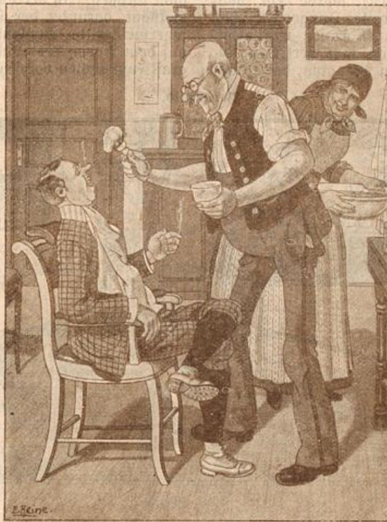
Guter Trost. Sommerfrischer: „Na, Herr Vater, die Hinterbarnleise ist 'n verflucht festes Möbel, bei der werd' ich demnächst mal fenstern gehn.“ Dorfvater: „Freist, da haben S' recht, und zum Verbinden kommen S' nacha zu mir, wann ich bitten darf!“

Eine köstliche Kälteschale. In der heißen Sommermonate herrscht ein solches Verlangen nach kühlen Getränken und Kälteschalen; leider gibt es nicht sehr viel Abwechslung darin, falls man die Verwendung von Wein bevorzugt, noch wenig bekannte, wohlfeile und mundende Kälteschale kann man selber herstellen, dessen Genuß außerordentlich gesund und blutreinigend ist. Man kocht die sauber zugeputzten fingerlange Stüchlein geschichteten Kälteschalen mit Wasser und Zucker zum Kompott, nur daß man die Stüchlein wechsfelchen läßt und sie dann durch ein feines Sieb passiert. Die misartige Mischung mit einem Gelbe (bei größeren Portionen mit mehreren) abgesehen von frischer süßer Milch bis zur Suppenstärke verdünnt und tüchtig verquirlt. Eine Prise Salz darf nicht vergessen werden. Der Geschmack dieser Kälteschale ist zerbrockelte Weinbiskuits oder Malzgerstmalz, ist außerordentlich erfrischend und gesund und dabei ist sie nahrhaft und verdaulich. Man pflegen sie leidenschaftlich erfrischen zu lassen, jede Mutter sollte ihren Kleinen diese Speise so oft wie möglich füttern, auch nachmittags oder abends, wenn Kinder nach dem Spielen im Freien erschöpft sind und nach einer Erfrischung verlangen, diese Kälteschale, nach dem Verdünnen, als Getränk reichen.