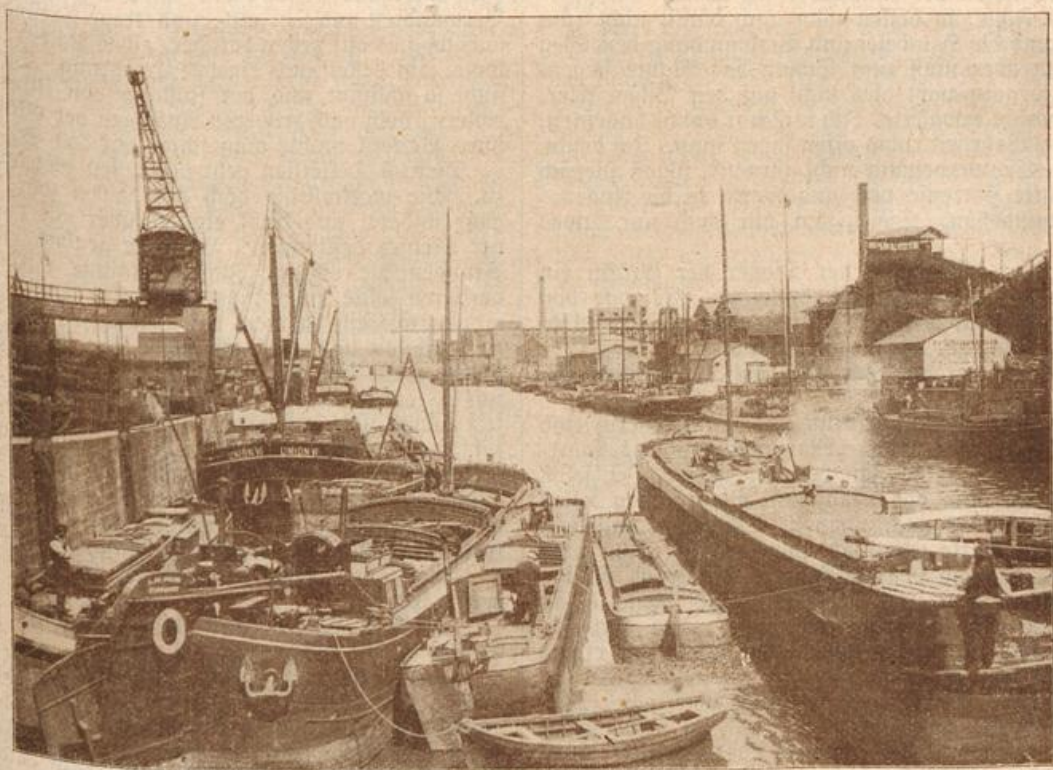
Brüssel als Seehafen. (Mit Text.)

Eine Falte schiebt sich zwischen Mays Brauen. Dietrich kennt dies nur zu gut. Er hat sie einst die Schmerzensfalte genannt, welche sich stets zeigte, wenn May in trauriger und bedrückter Stimmung gewesen, was damals allerdings sehr selten vorkam. Es gab einen wunden Punkt in Mays Leben, er sah es deutlich, und das war ihre Ehe mit dem Grafen, die, nach außen hin so glänzend und harmonisch, dennoch Mays einst so sonniges Leben verdunkelte. May, ja wenn er sie jetzt wiedergetroffen hätte, einsam und verlassen. Bei Gott, er würde sich glücklich schätzen, ihr ein Halt und Schutz sein zu können, — und vielleicht ihre Liebe zu ge-