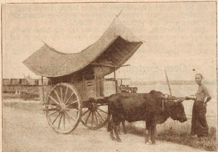
Lastkarren mit eigenartigem Sonnendach. (Mit Text.)

Belustigt reichte er ihr reuevoll, mich zu bessern!“ „Sie können es dennoch, als angehender Ehemann muß ich