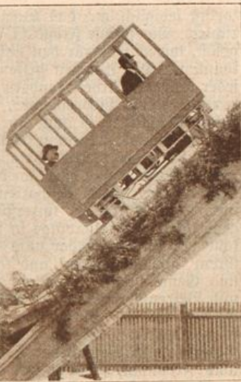
Ein räderloser Motorwagen. (Mit Text.)

„Wie Sie doch alles gleich erraten!“ neckte er sie. „Damit imponieren Sie mir aber gar nicht, lieber Freund, rief sie lustig. „Sie haben Sie, gedacht haben Sie bei Ihnen ein- und aus- nur habe ich bisher nie gesprochen.“ „Sie schlechter Mensch! verdient energisch bestraft werden“, und drohend erhob die Hand. „Ich werde mich sofort selber“, er heiter, nahm ihre Hand und bewachte sie mit vielen in- lassen. „Nun kann Ihnen wirklich jenen“, rief sie lachend. „Was soll man auch nicht!“