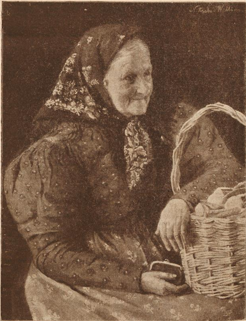
Schlesische Bäuerin. Nach einem Gemälde von Helene Nitsch-Willim. (Mit Text.)

„An eine Heirat denke“, vollendete sie schnell.