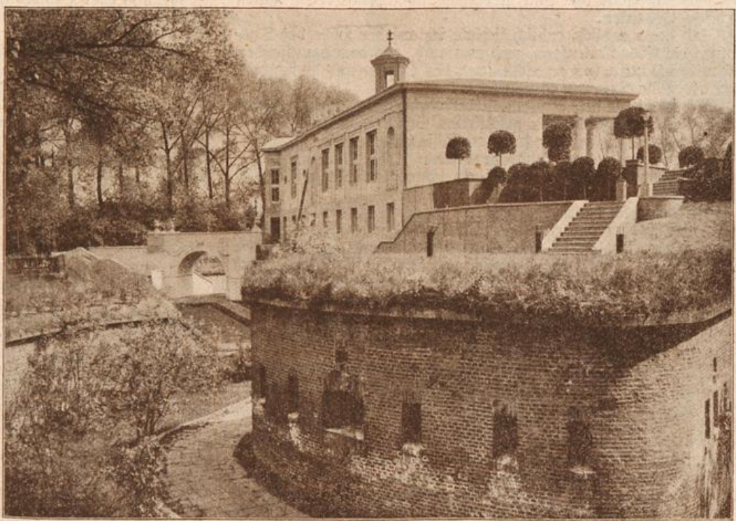
Die Deutsche Werlbund-Ausstellung in Köln: Das Techaus. (Mit Text.)