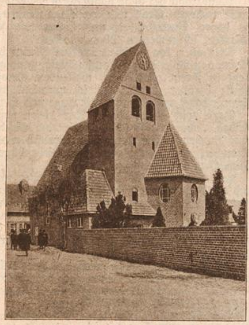
Werbund-Ausstellung: Niederrheinische Dorfkirche.

und durch die neue Eisenbahnbrücke auf die König-Karls-Brücke in Cannstatt. (Mit Text.) die Nacht, sah in verstonnenem Schweigen — Gemma. war sie? — Sie war die Liebe, sie war die Leiden- sie war der Schmerz, sie war Weib. Wo finde ich einen edleren, besseren Ausdruck was sie mir war? es mich? — Was sie da, und da sie da war, hing meinem Hals, ihre dunklen brannten in den meinen und ihren Küssen versengten mir die Zeit jenem Tage war ich mit Leib und Seele, und blütenüberwucherte Cam- pore küßete uns die Hochzeitsfeier. da ein Tag und an jenem Abend. — Wir saßen am brunnen und starteten ins märchenschöne Land. Gemma hielt die Laute am blauen und ihre schmalen, dünnen wühlten vergessen in den Vergang, eine Melodie, klagend und dann ein sehnlichthanges und dann fiel ihre tiefe, weiche ein und über die schwei- schen schluchzte und bebte ihr aus ihrem Liede. wieder habe ich singen hören, Gemma sang. Noch liegt unerhört aufwühlende Weise