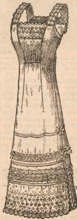
Unterrock mit geschl. Volant.

Duftig und leicht erscheint der Unterrock aus Batist, dessen Volant in einem hohen, geraden Stiderteil besteht. Die Weite schränkt am Ansatz des Rückenteiles eine Gruppe auspringender Säumchen ein. Die weitere Garnitur bilden Quersäume und leicht eingereichte Valenciennespitze. Um die nötige Schrittweite bei engem Fall zu erreichen, bildet der Volant rechts eine nach innen gerichtete Quetschfalte, während er links in halber Höhe geschlitzt ist. Statt des Schlitzes kann die Quetschfalte wiederholt werden. Den unteren Rand begrenzt ebenfalls ein eingereichtes Spitzchen, das dem Badenrand mittels überwendlicher Stiche angenäht ist. Ein gleicher Stiderteil ist dem Vordertheil oben angefügt; auch hier schränken auspringende Säumchen die untere Weite des geraden Stofftheiles ein. Ein schmaler Stidereigalon bildet die Träger und begrenzt den Rückenteil. Der obere Teil des Rocks erfordert 1,90 m Batist 85 cm breit.