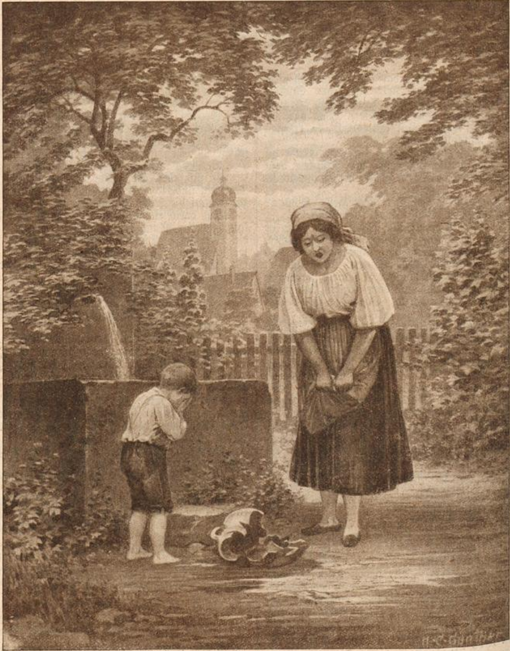
Der zerbrochene Krug. Originalzeichnung von H. G. Günther. (Mit Text.)

Renaissance von Blume zu Blume eilen wollte, Mailand, Rom, Neapel; alles wollte ich sehen, den edelsten Spuren benker Kunst folgen von ihren frühesten Tagen bis zur Gegenwart. Mit allem hatte ich gerechnet, nur mit dem Zaubern das Land selbst mit seiner wunderbar schönen seinem ins Irdische übersehten Himmelsglanze auf mich üben würde. Und so kam es, daß, allen Abichten zum Trotz, mein Weg mich immer mehr seitwärts jener Orte führte, im landläufigen Sinne das Elorado aller Italiensreisenden zu machen, daß ich völlig abseits der ausgetretenen Weltverkehrs einen Pfad fand zur Schönheit und Natur.