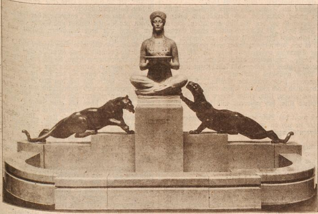
Der „Durstbrunnen“ im Kaiserlichen Jubiläumspark in Gomburg v. d. G. (Mit Text.)

Der Fürst, und ein Schatten trat in sein Antlitz. „Und nur eine kann es nicht verstehen, nicht einsehen. Haben Sie Dank für Ihre Freundschaft“, sagte er ernst und faßte der Gräfin Hand mit festem Druck. „Vielleicht darf ich eines Tages diese Freundschaft in Anspruch nehmen, und Sie werden mir nicht wehren?“