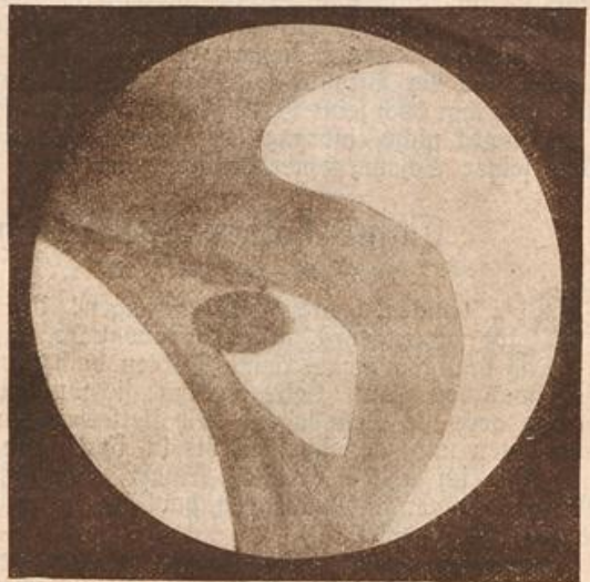
Radiographie eines gutverwachsenen Gummieliasis in einer Schenkel-Schlagader, acht Monate nach der Operation aufgenommen.

Mit Staunen sah der Vicomte durch eine Lücke im Vorhang, daß seine Gattin eintrat. Sie trug eine kleine Blendlaterne in der Hand, ihr sanftes Gesicht drückte Unruhe und inneren Kampf aus. Ohne viel Befinnen öffnete sie einen der Schränke, nahm einige Münzen heraus und barg sie in der Tasche ihres Kleides, dann verließ sie das Zimmer