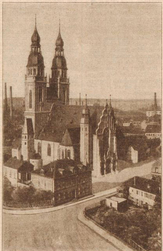
Neubau der St. Josephskirche in Speyer. (Mit Text.) Kunstverlag und Original J. L. Schmid, Speyer.

Sechs Monate vergingen, wäh-rend welcher die Schülerin be-deutende Fortschritte machte. Die schüchterne Verehrung, der Eifer, das bereitwillige Entgegenkommen