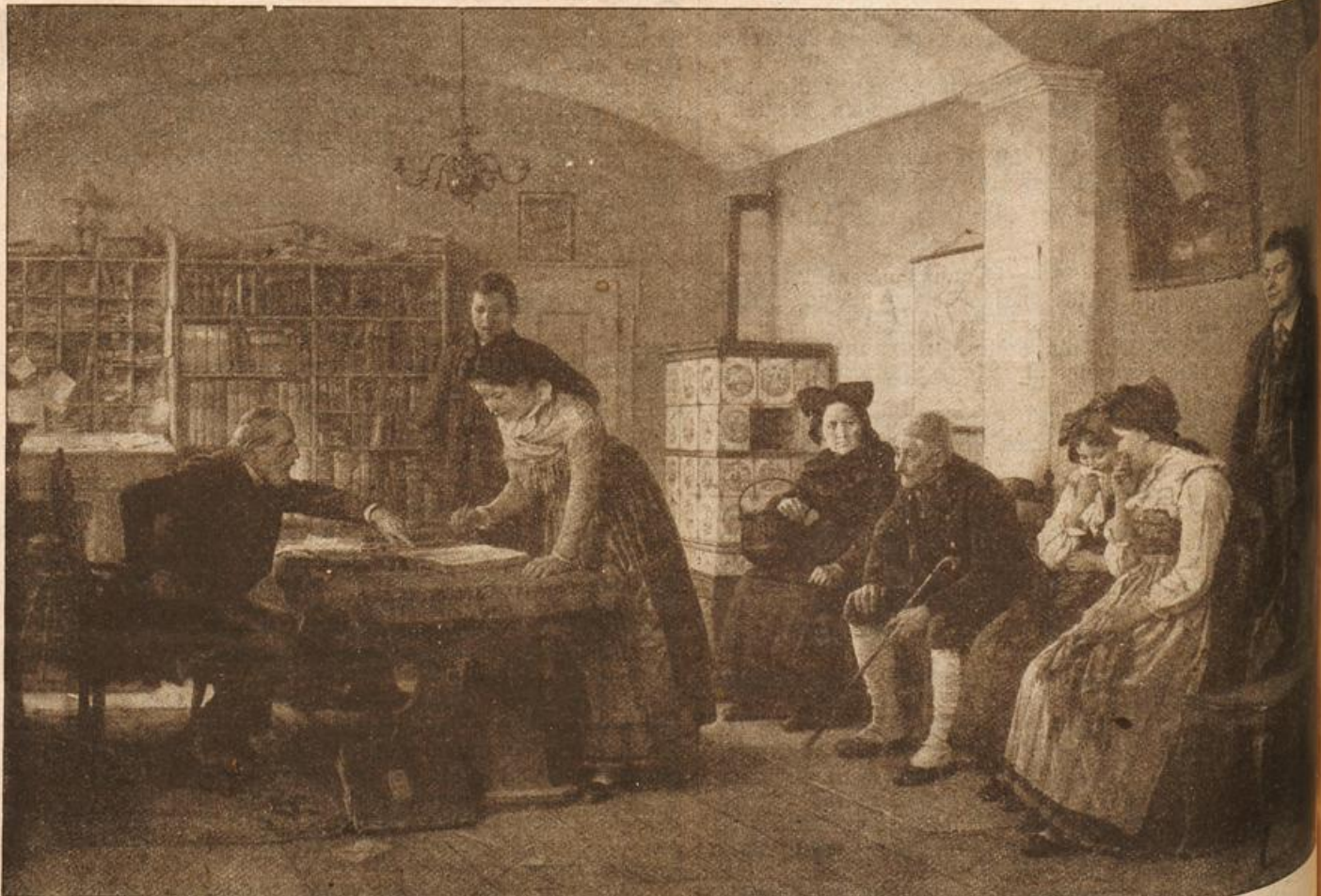
Auf dem Standesamt. Von V. Bantier. (Mit Text.)

Die Vicomtesse d'Arrelles seufzte, als sie ihren Gatten so gleich nach Tische verschwinden sah. Heute hatte sie jedoch einen glücklichen Tag, sie erhielt den überraschenden Besuch ihrer besten