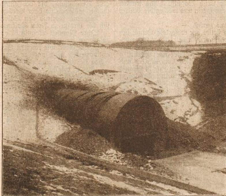
Durchsicht des Disfrasantunnels bei Schlüßtern-Flöden. (Mit Text.)

„Und so wohlthätig wie du?“ fragte die Freundin. Die Vicomtesse nickte und fuhr fort: „Und doch fehlt mir um glücklich zu sein: mein Mann ist gleichgültig, fast kalt, weil er mir nicht zugetan wäre, aber es tritt etwas zwischen