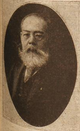
Graf Aoki, Vorsitzender japanischer Staatsmann. (Mit Text.)

„Nun, beruhige dich, liebe Hortense,“ jagte nun der Vicomte,