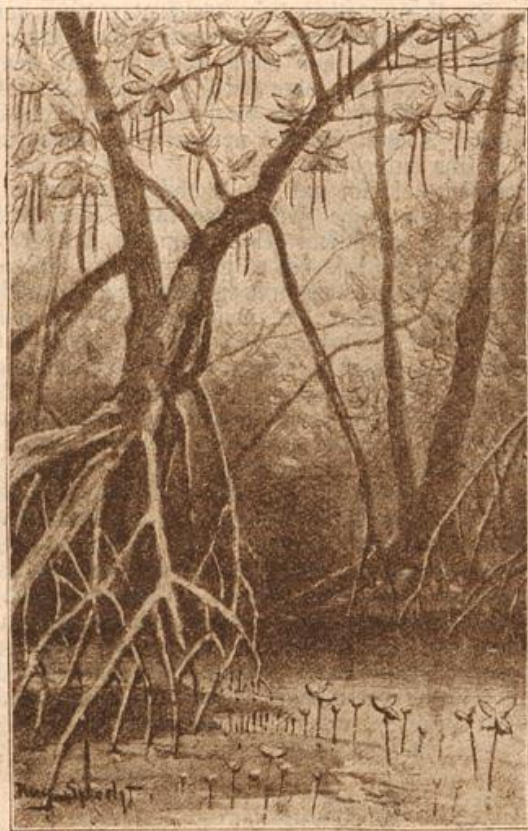
Eine lebendiggebärende Pflanze. (Mit Text.)

Vor drei Tagen abends, als die Eskadron vor dem Stalle angetreten stand und der Dienst für den anderen Tag bekannt gegeben wurde, hatte unser Wachtmeister sein schwarzes Buch, welches manchen von uns ein gewisses Angstgefühl überkommen ließ, in die Hand genommen; die Dreijährigen behaupteten, einige von ihnen seien darin dauernd verewigt und würden zu jedem Arbeitsdienst und Macherzieren usw. daraus verlesen. Wie es genau mit dem Buche stand, weiß ich freilich nicht, denn es wurde von seinem Besitzer wie ein Heiligtum gehütet, und nach meinem Wissen hat nie ein anderer einen Einblick in das Buch erhalten. Der Gestrenge schritt die Front ab, jeden einzelnen mustern und dann hier und dort einen aus dem Gliede winkend. Auch ich befand mich unter den Ausgewählten und empfand dies mit verschiedenen Gefühlen, denn auch ich hatte schon Gelegenheit gehabt, zu irgendeinem Extravergnügen noch auf dem Kasernenhofe zu bleiben, nachdem die Eskadron abgetreten war und die anderen Kameraden auf ihren Stuben der Ruhe pflegten.