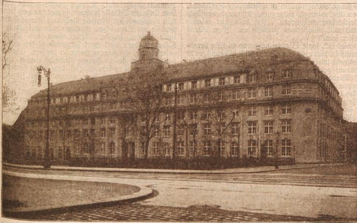
Der Neubau der Dresdener Ortstrankentasse. (Mit Text.)

„Zur Schauspielerin bist du geboren“, dachte er. Er staunte über ihre große Beherrschung, denn was sie da vorgebracht, davon glaubte er kein Wort. Wenn er geahnt, daß die Baronesse in ihm einen Heiratskandidaten erblickte, nie wäre er zugegen gewesen, wenn sie die Schwesterbesuchte. Warum mußte es der Zufall bringen, daß sie ihn allein im Garten antraf — Hildegard war