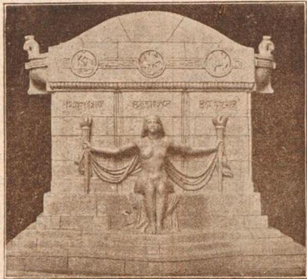
Ein deutsches Denkmal für Amerika. (Mit Text.)

Wir erhielten in diesem Jahre zwei- und siebenzig Remonten und führten sie immer drei und drei zusammengekoppelt zur nahegelegenen Eisenbahnstation zum Verladen. — Unter unseren Pferden fiel mir ein besonders übermütiger brauner Wallach auf, welcher sich nicht geduldig wie die übrigen Pferde entführen ließ, sondern fortwährend die tollsten Sprünge machte, sein Führer hatte demnach viele Arbeit mit ihm und hinkte bereits neben seiner Koppelung her, weil der Braune ihn verschiedentlich beim Tanzen auf den rechten Fuß getreten hatte. Auf Anordnung des Unteroffiziers Wiegandt wurde der Widerspenstige dann von den anderen Pferden losgekoppelt und mir zum Führen übergeben, weil ich bisher keine Koppelung hatte. Ich führte