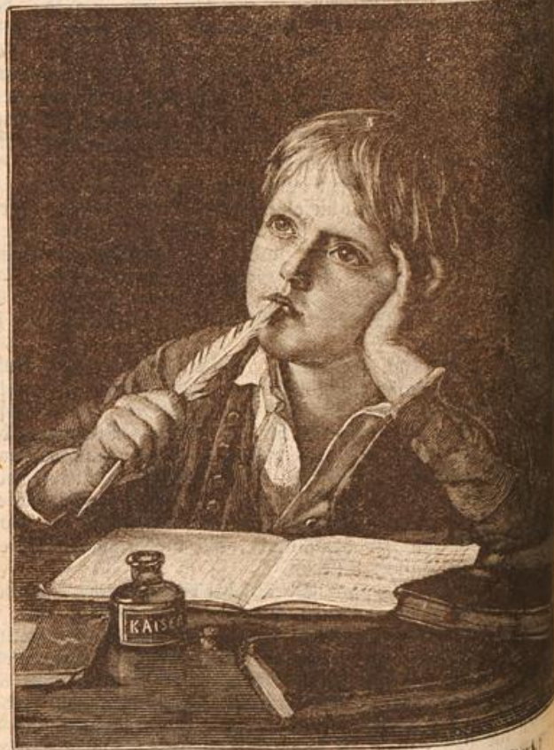
Der erste Aufsatz. Von Julius Günther. (Mit Text.)