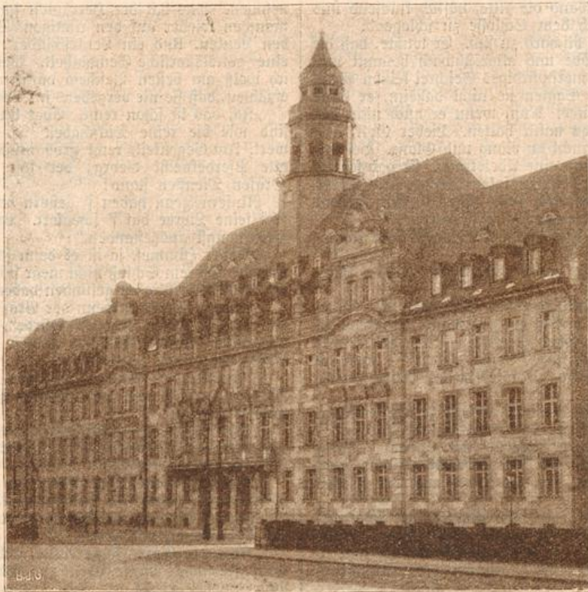
Das neue Polizeipräsidium in Frankfurt a. M. (Mit Text.)

ment, welcher noch eine kurze Inspektion hielt. Unter dem Kommando des Unterleutnants Wiegandt, welcher ebenfalls zum Kommando gehörte, erhielten wir die nötigen Weisungen, und hierauf marschierten wir endlich zum Kasernenhof hinaus nach dem Bahnhof; dort erwartete uns ein Oberleutnant, der zufällig meine Ausbildung geleitet hatte und zu unserer Eskadron gehörte. Trotz der frühen Morgenstunden waren wir schon alle recht lebendig und stiegen begeistert