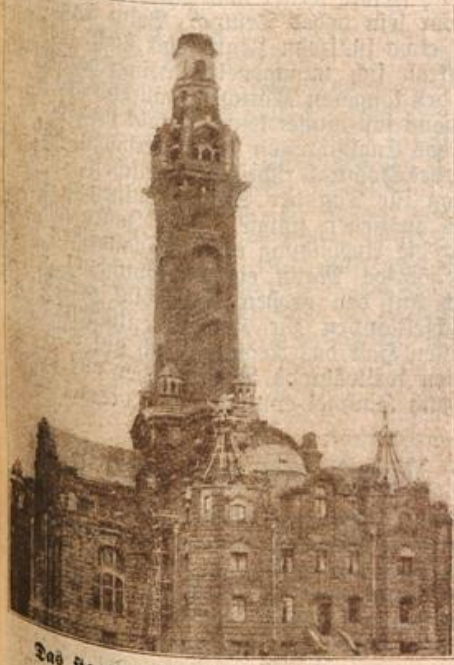
Das staatliche Fernheizwerk in Dresden. (Mit Text.)

alle Quartier. Der andere Tag war ein Ruhetag. Ich benutzte die Gelegenheit, von hier eine Karte nach Hause zu schreiben, um die Meinigen zu überzeugen, daß ich wirklich dieses Mal kein Rätsel erfunden hatte, um von ihnen Geld zu erbitten. Ansichtskarten von hier gab es leider nicht, doch genügte eine einfache Postkarte auch, denn der Posttempel konnte ja nicht trügen.