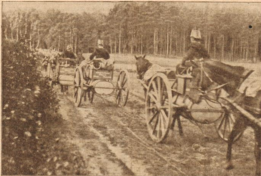
Verpflegung und Ausrüstung des Millionenheeres: Wasserwagen. (Mit Text.)

Kandelaber mit glitzernden Kristallprismen niederstrahlte, noch keine Behaglichkeit, denn die meisten der Möbel, die hier stehen sollten, Wandgemälde und sonst allerlei Sachen, waren noch nicht ausgepackt. Das stand in Kisten und Kästen draußen herum. Waren gestern ja doch die Handwerker erst fertig geworden im Schloß. Auf dem dunklen Mahagonitisch stand auf silbernem Tablett eine Sektflasche und ein halbleeres Glas. — Das