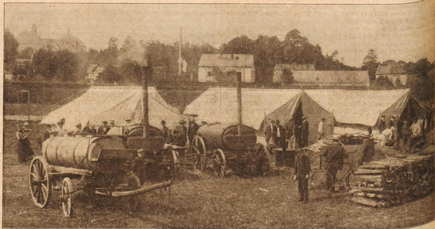
Verpflegung und Ausrüstung des Millionenheeres: Feldbäckerei. (Mit Text.)

Als er dann weiter ging, sah er an einer der Anschlagtafeln ein großes Plakat in grellen Farben und Lettern leuchten. Und da kam neues Leben in ihn. Sein Gesicht bekam Farbe, seine Hände spielten nervös mit dem Stock, und ein leises Zittern ging