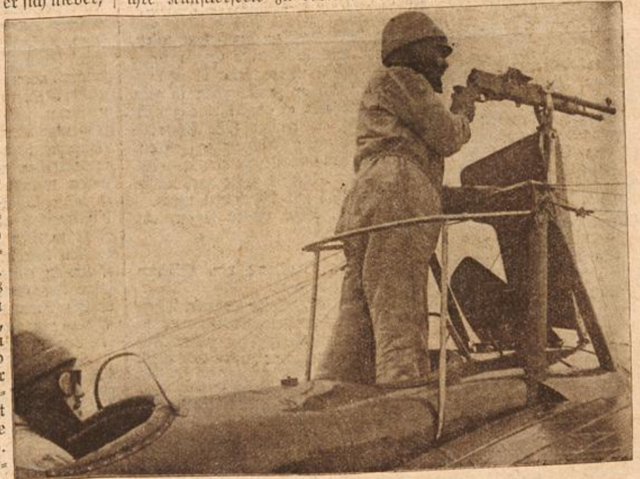
Ein gepanzertes französisches Flugzeug. (Mit Text.)