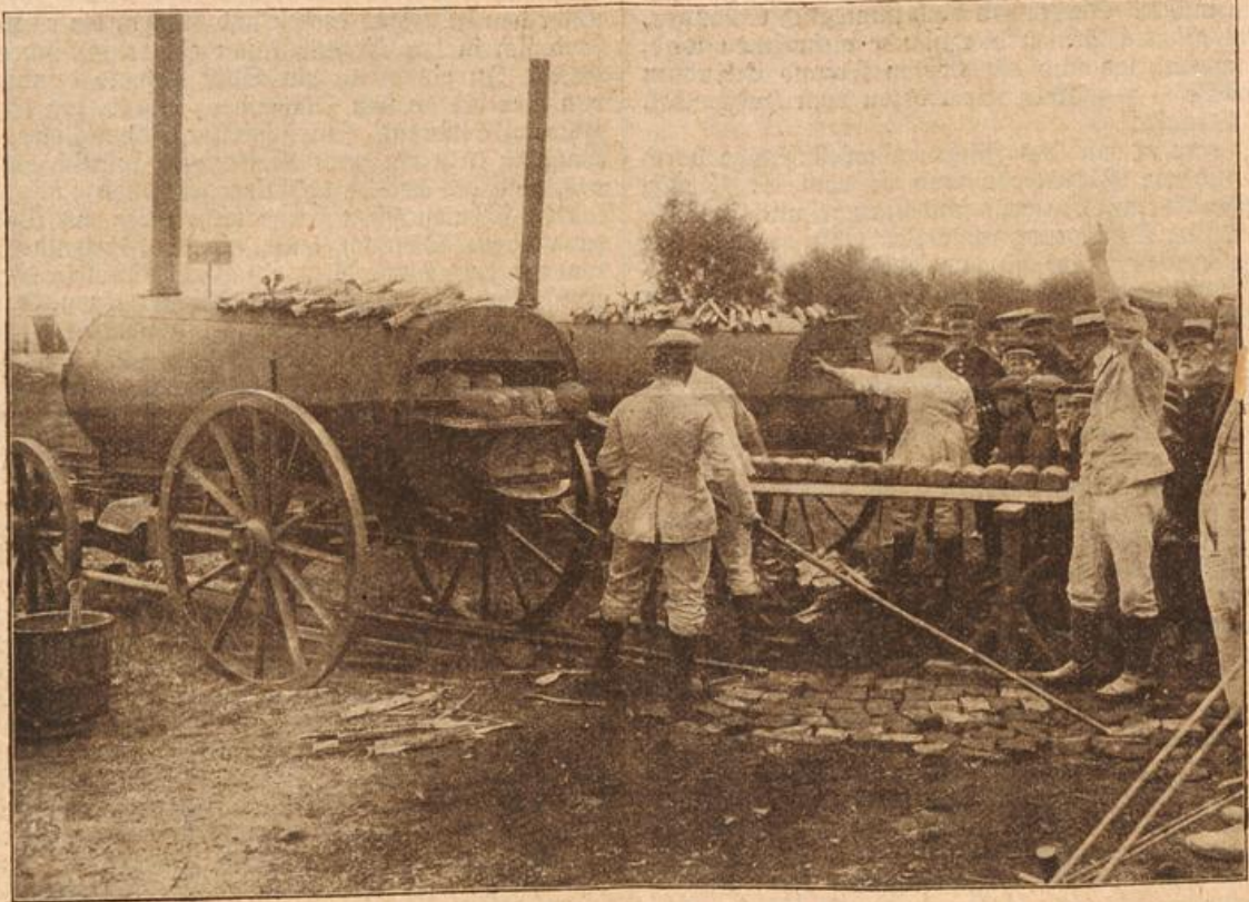
Verpflegung und Ausrüstung des Millionenheeres: Badöfen. (Mit Text.)

indessen nicht über sich. Er kam ihr, trotz Zobelpelz und funkeln dem Brillantknopf auf dem Ehemiet, gar so gewöhnlich vor. „Vater, da ist Besuch!“ flüsterte sie diesem zu, als er gerade mit martigen Zügen seinen Namen unter den eben vollendeten Brief setzte. „Der Herr Zuchow aus Finkenwerder.“ „Was zum Henker! Bomben und Granaten, dieser Pflanze —“ „Nicht so laut, Väterchen! Er steht ja im Entree!“ „Der wagt es wirklich, bei anständigen Leuten Besuch zu machen? Nötige ihn hier ins Bureau. In die gute Stube gehört so ein Strabattendreher nicht. Mag nur geschäftlich wegen des Holzhandels mit ihm verkehren.“ Zuchow stand inzwischen da und dachte nur: „Welch ein grandioses Weib! Wie ist das möglich?! Die mal lachen sehen, das muß gottvoll sein. Aber scheint eine kalte Schöne zu sein.“