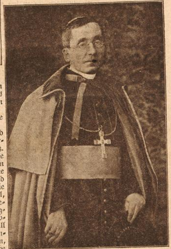
Papst Benedikt XV., Kardinal della Chiesa. (Mit Text.)

Dann aber erwachte in ihr die Künstlernatur. Was lange geschlummert hatte, das wurde plötzlich wach und drängte hervor mit Allgewalt, mit genialer Kraft. Zu eng wurden ihr die kleinlichen Verhältnisse der Heimat, zu leidenschaftlich pulste ihr Blut. Hinaus in die Welt! Um das zu werden, wonach ihre Phantasie schmachtete. Und nichts mehr hielt sie zurück in dem kleinen Ort, in dem ihre Künstlerseele zu verkommen drohte.