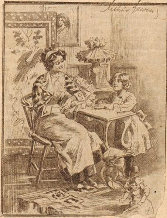
Die kleine Trude: „Mama, Onkel Rechtsanwält sprach gestern immer von Gesichtspunkten, meinte er da Tantes Sommerprossen?“

Ein gepanzertes französisches Flugzeug , ausgerüstet mit einem Geschütz zur Vernichtung gegnerischer Flugzeuge und zur Jagd auf Luftschiffe. Mit diesem Flugzeug wurden kurz vor dem Ausbruch des Krieges in Villacoublay bei Paris Versuche gemacht. Von Erfolgen dieser Panzerflugzeuge hat man aber bisher ebenwienig gehört, als von der Fliiegerinvasion, durch die am ersten Kriegstag die bahnhöfe auf der deutschen Aufmarschlinie Rheinbrücken und die Hauptzerstört werden sollten.