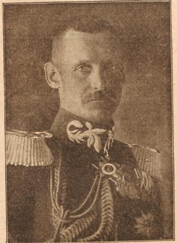
Generaloberst und Generalinspekteur Kronprinz Rupprecht von Bayern.

Aber da kam er schon an. „Was, jetzt willst du fort? Jetzt mich allein lassen? Nein, das dulde ich nicht!“ rief sie.