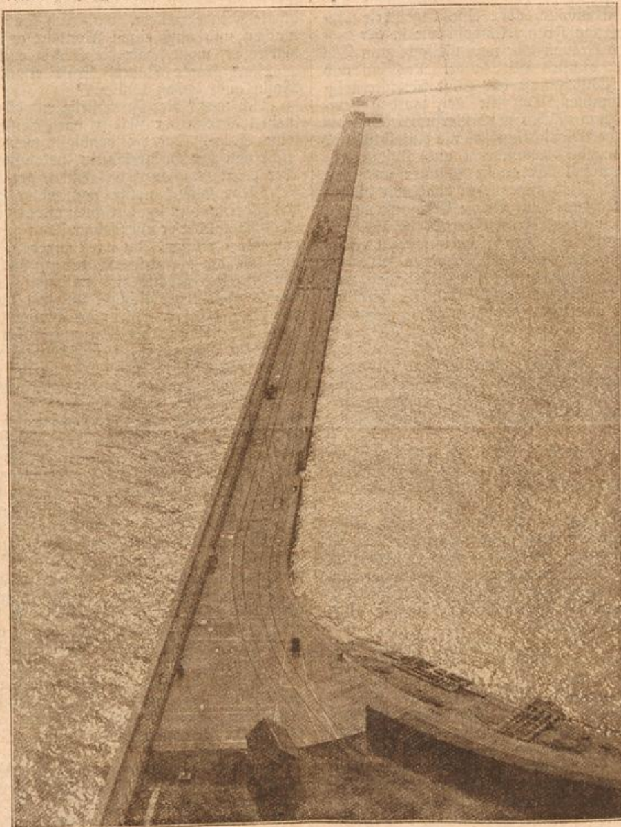
Der Kriegshafen von Dover, einer der Hauptstützpunkte der englischen Flotte. (Mit Text.)

Eines Tages fehlte der Schlüssel zum Nähtisch. Die Köchin hatte Nadel und Faden gebraucht. Endlich nach langem Suchen wurde er im Hofe gefunden, über und über vom Rost bedeckt und unbrauchbar. Er mußte an dieser Stelle mindestens zwei Wochen liegen.