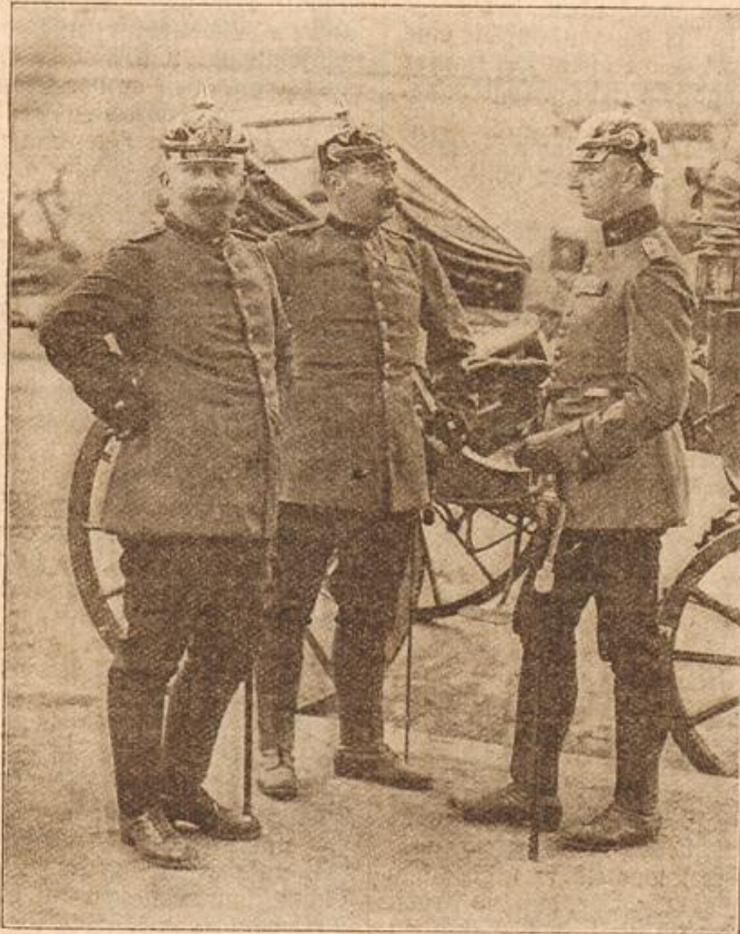
Die deutsche Feldpost: Höhere Postbeamte in Felduniform.

„Na, wie geht's denn nun, mein Jungchen? Hast du auch immer gut zu tun?“ fragte Tantchen besorgt, als der Wagen sich endlich schwerfällig fortbewegte.