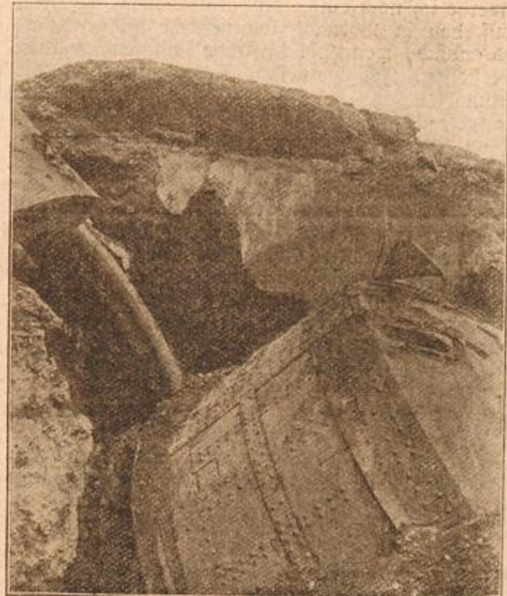
Die Wirkung der deutschen Belagerungsgeschütze an den Forts von Lüttich. (Mit Text.)

als er den so schwer bepacten jungen Mann herankommen sah.