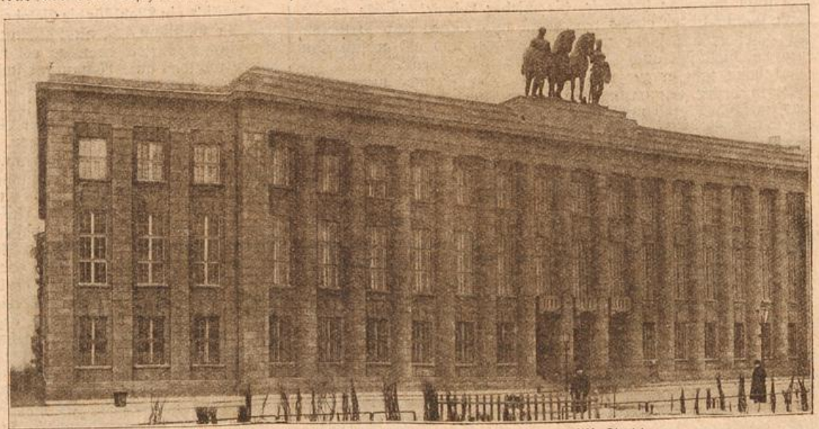
Das deutsche Gesandtschaftsgebäude in Petersburg. (Mit Text.)