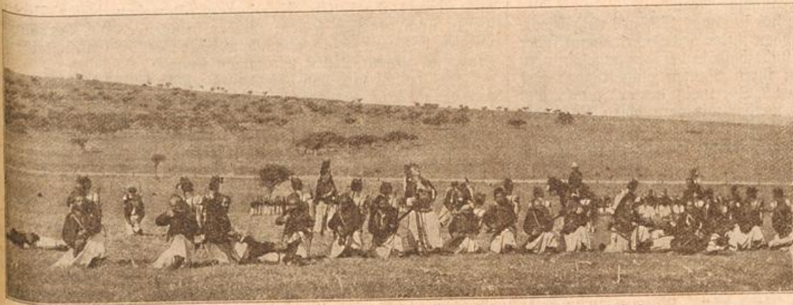
Aus dem französischen Heer: Algerische Tirailleure (Zirkos). (Mit Text.)

„Gott, man quält sich eben redlich,“ meinte er etwas kleinlaut, leicht gemacht wird es einem nicht, das kannst du glauben.“ Sie nickte zustimmend: „Das glaube ich wohl, mein Jung, aber das ist doch nun mal nicht anders, wir haben uns ja alle quälen müssen; na, und so lange man jung ist, arbeitet man ja auch gern, nicht wahr?“