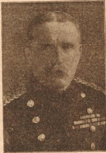
General French, der Oberkommandierende des englischen Landungsheeres. (Mit Text.)

kein Ende fand, fragte er: „Du sprichst doch vorhin von einer besonderen Überraschung, die du diesmal mitgebracht hast. Nun, was ist denn das eigentlich?“ „Nur Geduld, mein Jung!“