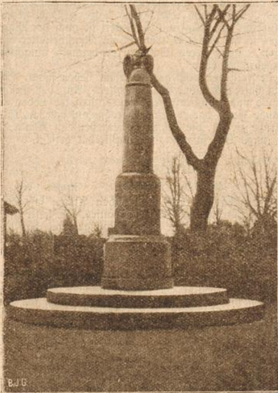
Denkmal zur Erinnerung an die im dänischen Kriege gefallenen Esterreicher. (Mit Text.)

ner großen Fabrik, und die Kinder kosteten viel Geld. Aber nicht wahr — ich freue mich so, einen Landsmann hier zu finden, wo wir so gar keine Freunde haben — Sie kommen zu uns, Sie besuchen uns, Sie bringen Ihre Gedichte mit und lesen uns vor? Kommen Sie Sonntag mittag, ich mache Ihnen einen guten Gänsebraten — ich weiß, Sie mochten ihn als Schüler so gern.“