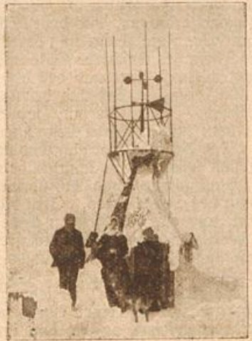
Die Sântisgipfelpyramide.

Meiche. Sie ermunterte ihn mit denselben guten Worten, mit denen sie Friedrich in seiner untergeordneten Arbeit freudig er-