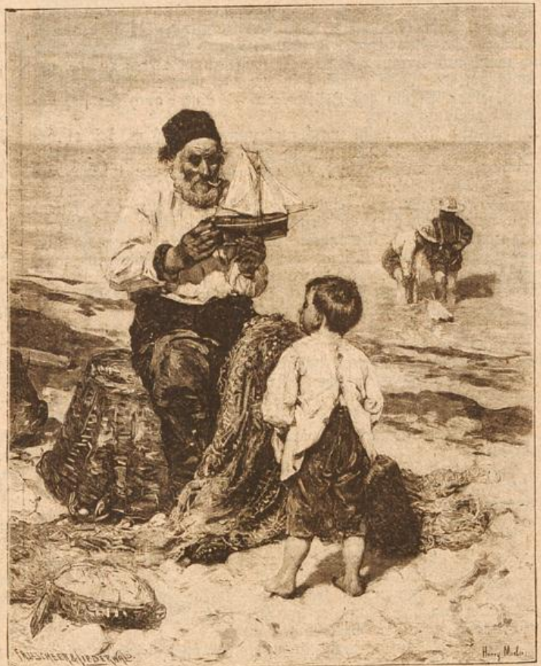
An der See. Nach dem Gemälde von H. Mosler. (Mit Text.)