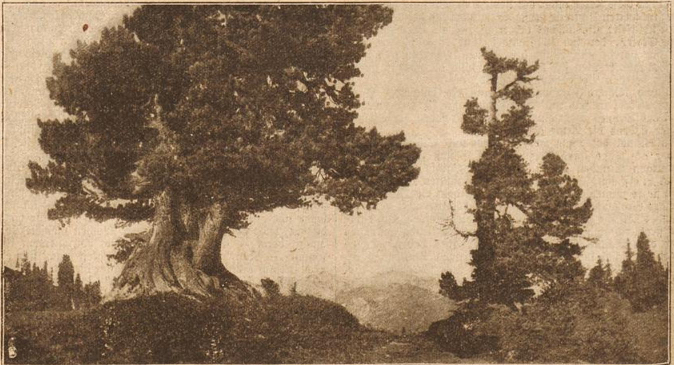
Waste Miesen-Arden in der Schweiz. (Mit Text.)

wenn der Flug der Gedanken erlahmte, wenn es öd und kalt schien in seiner „möblierten“ Stube der Lühovstraße, dann fuhr er hinaus zu Loddien, eines heitern Willkommen im Familienkreise sich