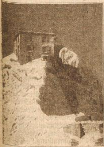
Das Sântisobservatorium.