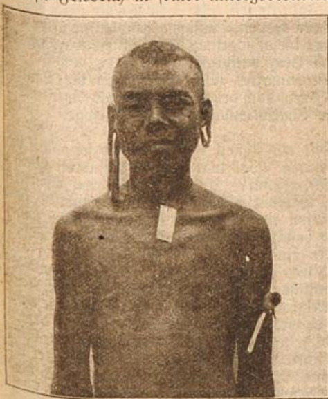
Eingeborener aus dem Bismarck-Archipel. (Mit Text.)