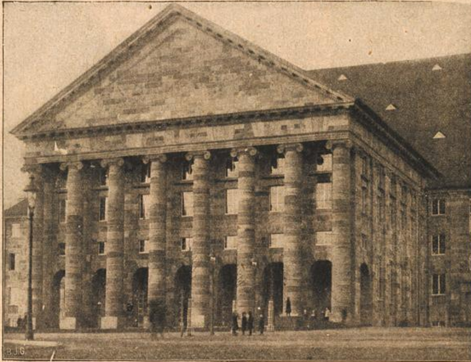
Zur Vollendung der neuen Stadthalle in Kassel. (S. 3.)

„Das Schloß werde ich verlassen, denn Sie sind der Herr desselben, aber vor der eisernen Gittertür zerschellt Ihre Macht.“ Mit Ruhe, doch Bestimmtheit hat Fritz Valder diese Worte gesprochen.