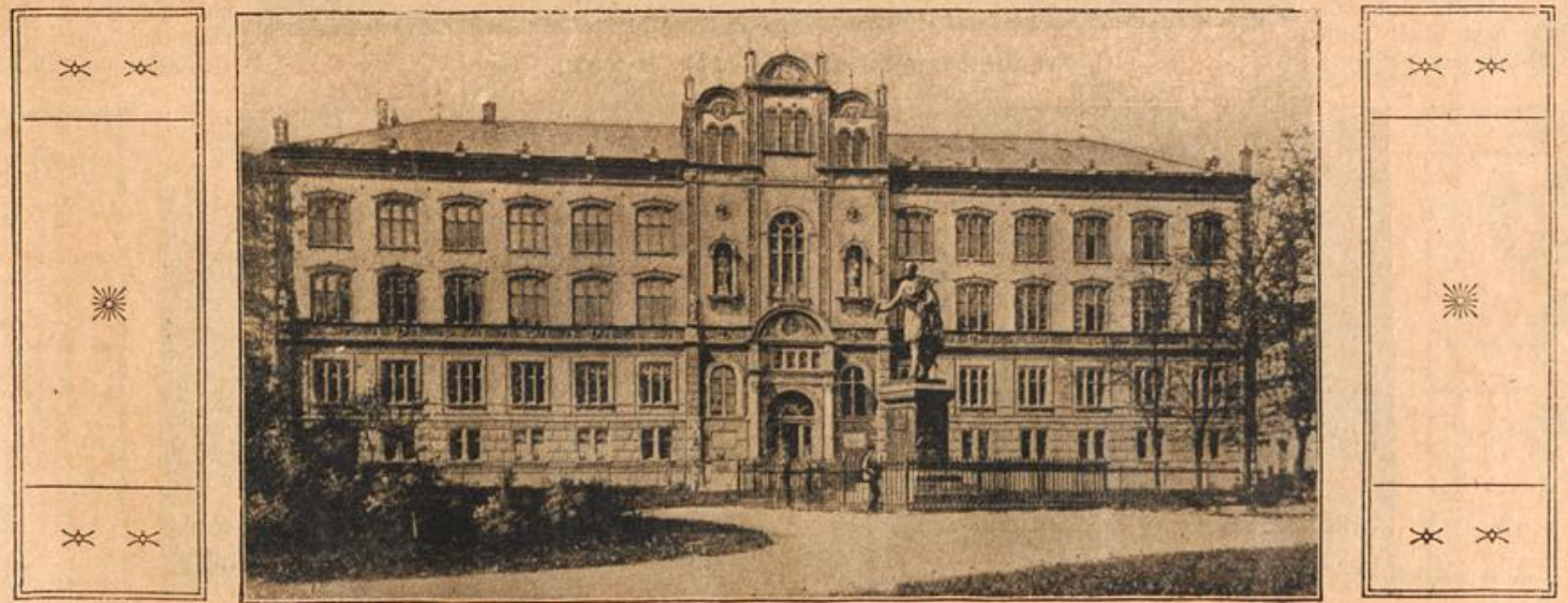
Zur Erweiterung der Universität Rostock. (E. S.)