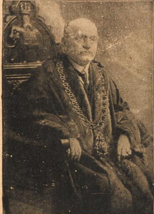
Ein Deutscher als englischer Bürgermeister.