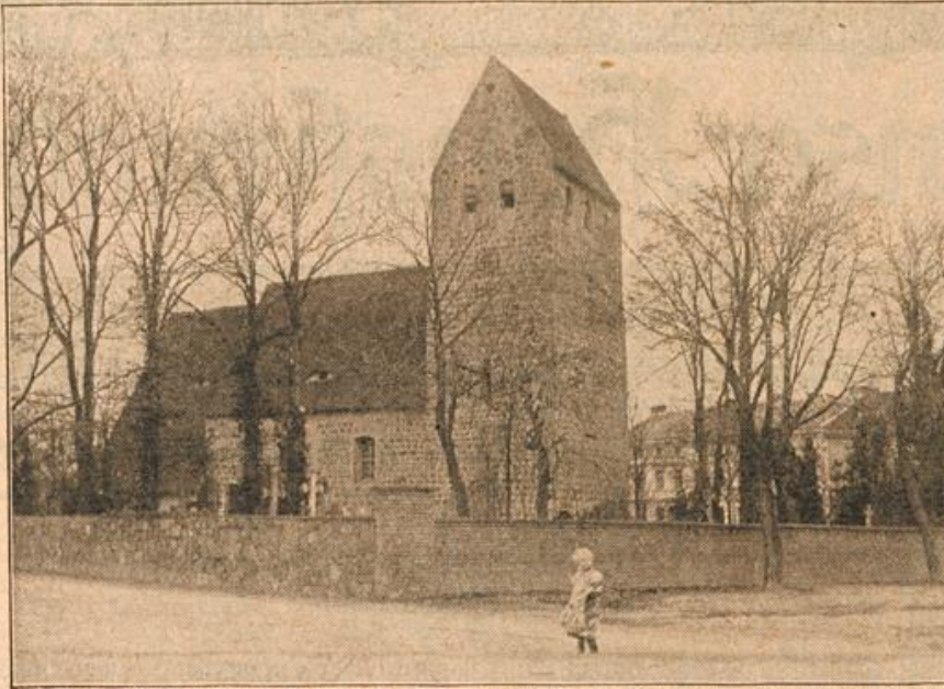
Eine 700 jährige Kirche bei Berlin, eines der ältesten Bauwerke der Mark. (S. 2.)

„Also auch Du — auch Du!“ tönte es von seinen Lippen,