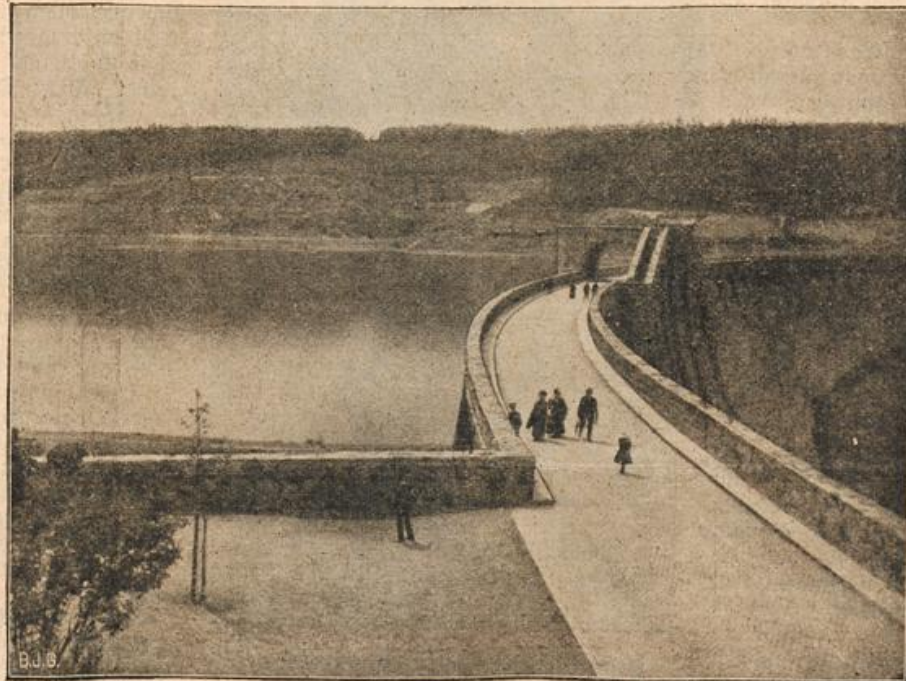
Die Zalsperre in Klingenberg (Sachsen). (Mit Text.)