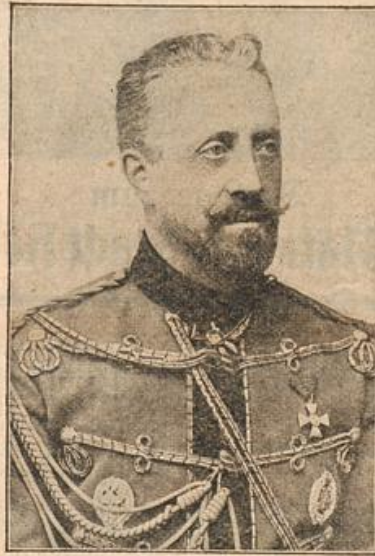
Großfürst Nikolaj Nikolajewitsch, ein fanatischer Deutschenhasser. (Mit Text.)

Hell und herb erklangen sie ihm. Und da kam es über ihn wie eine große Traurigkeit, und es war ihm, als sähe er sein Glück entschwinden in weite, weite Fernen.