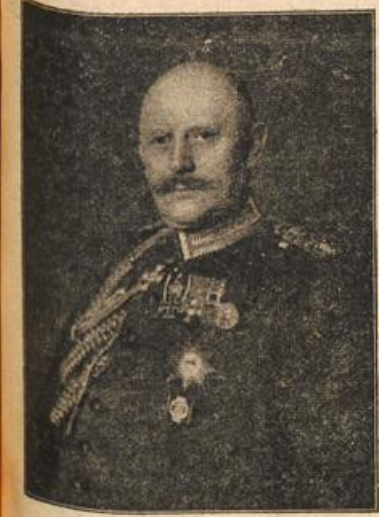
Generaloberst Helmuth v. Moltke, Chef des Generalstabes der deutschen Armee. (Mit Text.)

Aber mit einem Male öffnete sich nebean die Tür und Fräulein Eva rief lachend: „Aber, lieber Herr Doktor!“ Und da plötzlich saßen der Rasende wie im Umsehen wieder sanft und still. Und wurde der Rasende wie im Umsehen wieder sanft und still. Und wurde der Rasende wie im Umsehen wieder sanft und still. Und wurde der Rasende wie im Umsehen wieder sanft und still.