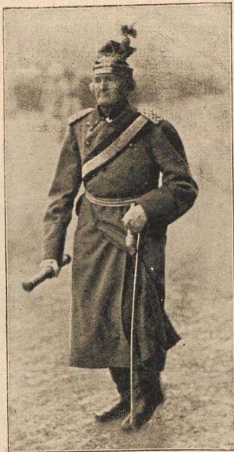
General-Feldmarschall Graf von Häfeler.