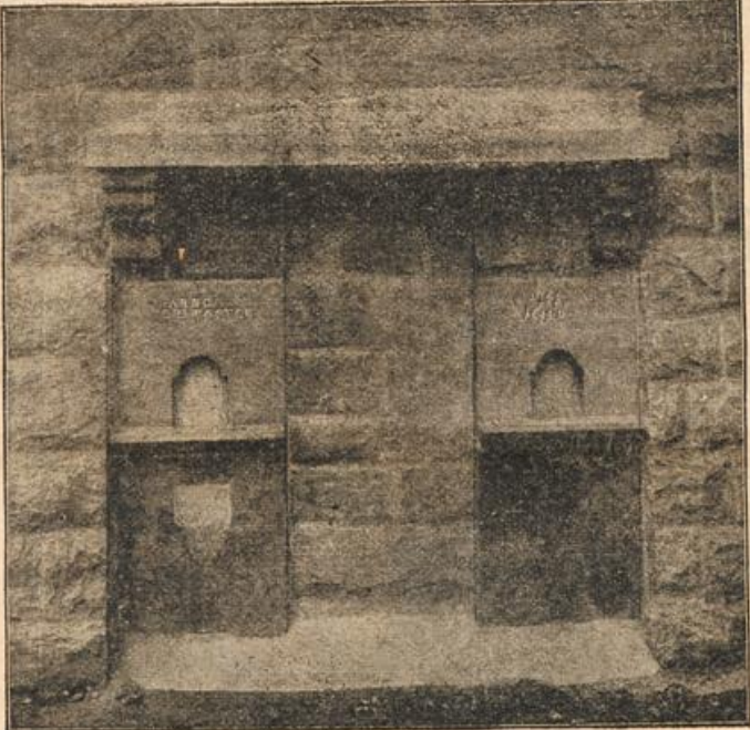
Ein Kochherd als Denkmal. (Mit Text.)

Korporal, ich bin bestohlen worden; mein Goldstück ist verschwunden!“ meldete ein Pariser Rekrut seinem Unteroffizier. Der Unteroffizier ließ seine Leute zusammenkommen und forderte den Dieb auf, das Goldstück herauszugeben. Niemand meldete sich, und jeder beteuerte seine Unschuld. Der Unteroffizier ließ nun durch einen Gefreiten seine Leute und die Tornister durchsuchen, das Goldstück fand sich nicht. Die über den Verdacht empörten Soldaten stellten nun ihrem Vorgesetzten vor, daß der Rekrut sein Geld verloren haben müsse. Allein dieser beharrte auf seiner Anzeige.