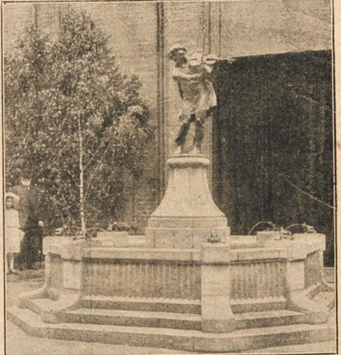
Der Flüssigbrunnen in Thorn. (Mit Text.)

Die Leute zogen der Reihe nach. Plötzlich bemerkte der Unteroffizier, daß einer der Leute, ein Soldat namens Dubois, heimlich von seinem Strohhalm ein Stück abbrach.