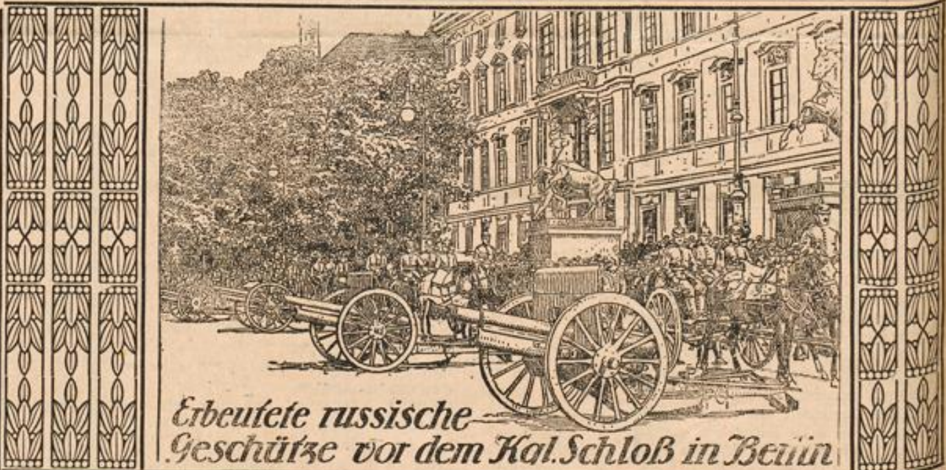
Erbeutete russische Geschütze vor dem Kaiser-Schloß in Berlin

— Antwerpen. Nicht nur für den belgischen Handel, sondern als einer der Knotenpunkte für den gesamten mitteleuropäischen Verkehr ist der Schiffschiffahrt Antwerpens von weittragender Bedeutung. Unseren deutschen Hansestädten Hamburg und Bremen ist durch die belgische Schiffschiffahrt schon seit langem eine schwerwiegende Konkurrenz erwachsen. Vor 20 Jahren blieb Hamburg im Wettbewerb mit Antwerpen diesem