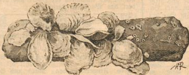
Austernbrut an einem Stück Kalkstein.

Rüsten und legen sie auf ihren Gründen aus, um sie wohlschmeckender zu machen. Austern aus der Nordsee oder von Helgoland bekommen jedoch nie den feinen Geschmack, wie die echten Natives, welche hauptsächlich von den natürlichen Bänken im Themsebusen zwischen Morgate und Harwich geholt werden. Einen ganz besonderen Ruf haben die grünen Austern von Marennes und La Tremblade. Was den Nährwert der Auster betrifft, so ist derselbe ein hoher und steht den besten Fleischsorten gleich; doch steht der Einföhrung als Volksnahrungsmittel der Preis entgegen, der wenigstens fünf- bis sechsmal höher wie für das beste Rindfleisch ist.