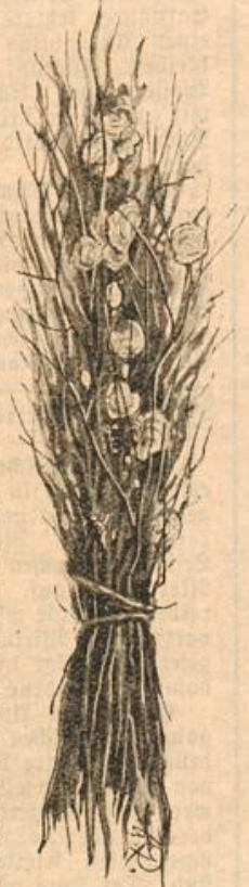
Austernbrut in Faschinen.

Anlaß geben kann; denn in Wirklichkeit stammen alle die als Flensburger jetzt in den Handel kommenden Austern von der Westküste der Strecke von Husum bis Londern gegenüber, zwischen den Inseln Föhr, Sylt usw. Das Wattenmeer bietet der Auster auf seinem Grunde alle Bedingungen zum Leben und zur Fortpflanzung, und an den Abhängen der tiefen Wasserinnen, welche daselbst durchziehen, finden sich die Austerbänke. Die feinsten Austern jedoch sind die Natives der Engländer, welche in Whitstable an dem südlichen Ufer der Themsemündung gezüchtet werden. Es sind dies keine natürlichen Bänke, vielmehr beziehen die Whitstable Züchter Austern von natürlichen Bänken der Nordsee, im englischen Kanal, an den irischen