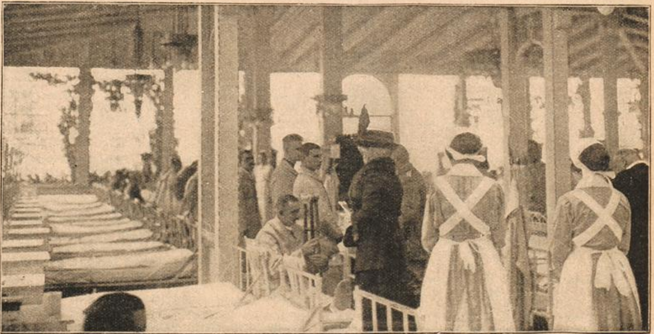
Besuch der deutschen Kaiserin im Lazarett der Grunewald-Kennbahn bei Berlin, bei welcher Gelegenheit die hohe Frau Weihnachtsüberraschungen an die verwundeten Krieger verteilte.

ihren kleinen, weißen Mausezähnen das Marzipantierchen verspeisen.