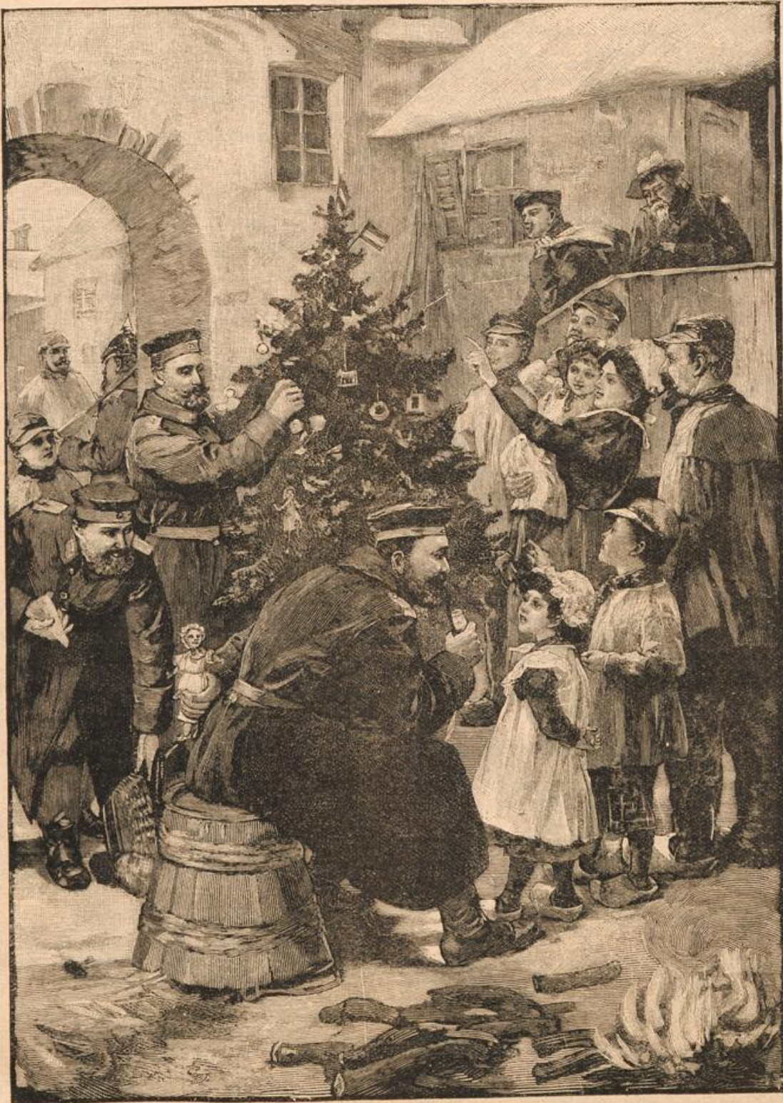
Weihnachten in Feindesland.

Langsam erhob sich Harm, rechte seine schlanken, sehnigen Glieder. Vier Wegstunden — wenn man sich nicht verließ — beim Schneetreiben konnte das einem auf der Heide bald passieren . . .