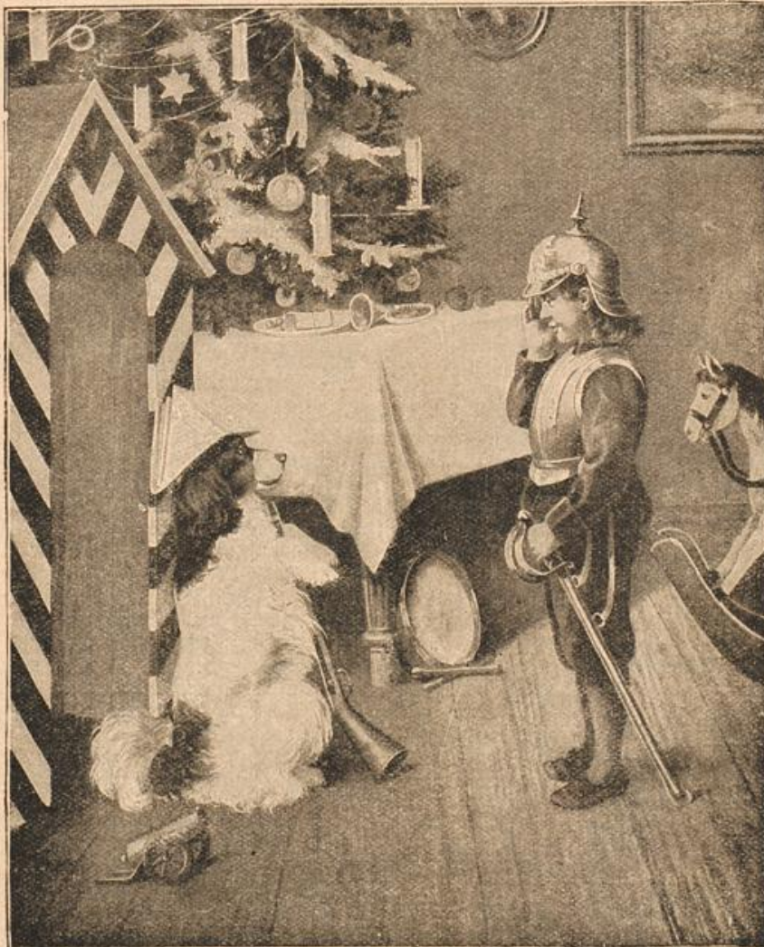
Soldaten unter dem Weihnachtsbaum.