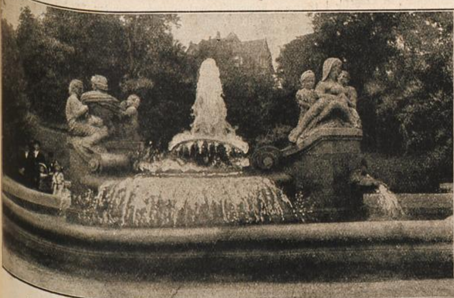
Von der Fünfhundertjahrfeier der Stadt Crimmitschau in Sachsen: Der am 13. Juni enthüllte Jubiläumsbrunnen im Stadtpark.

Durch diese energisch durchgeführten Sanierungsmaßnahmen erlosch ... die Fieberseuche nach und nach vollständig. Heutzutage gilt Santos als ... fieberfrei, wenigstens nach den amtlichen Angaben. Die Stadt selbst er- ... holte sich dank ihrer günstigen Verkehrslage sehr rasch wieder von ... dem entseßlichen Rück- ... schlage und wurde ... heute eine blühende