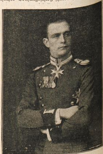
Adolf Friedrich, der jetzige Großherzog von Mecklenburg-Strelitz.

Endlich ist alle Ladung gelöscht, wir sollen die Anker lichten. Jedoch auch bei der Ausfahrt am 26. November spielte uns die Barre durch ihren tobenden Wellengang nochmals einen bösen Streich und hielt uns samt weiteren fünf Dampfern nochmals vierundzwanzig Stunden im Hafen zurück. Aber was will dieser kleine Zeitverlust bedeuten im Hinblick auf die amtlich festgestellte Tatsache, daß Schiffe mittleren Tiefganges (etwa 16 Fuß) durch schlechte Witterungs- und Dämmungsverhältnisse volle zwei bis drei Wochen, ja