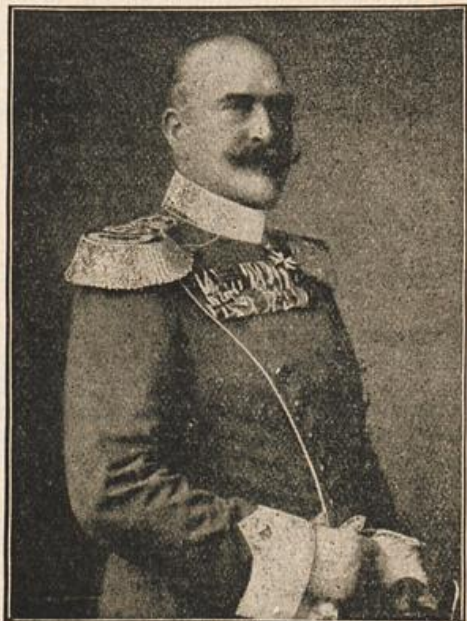
Großherzog Adolf Friedrich von Mecklenburg-Strelitz †.

Vortrefflich fügt sich die nahe 1899 erbaute deutsch-amerikanische Erlöserkirche in den grünen Rahmen ein; ihre geschmackvolle, zierliche Gotik mit den grün-umrankten Spitzbogenfenstern, sowie die weinliche Sauberkeit des kühlen, hellen Zimerraumes