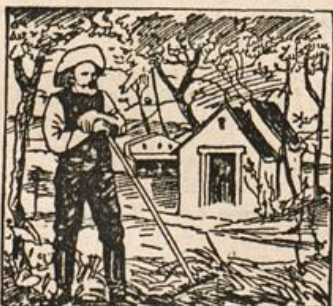
Wo ist mein Gehilfe?

(Aber Frischen!) Frischen: „Ich bin heute im Rechnen zwei 'rausgekommen, Tante.“ — Tante: „So, dann bist du wohl ein kleiner Rechenkünstler? Nun rechne mir doch schnell einmal aus, wie alt ich bin.“ — Frischen: „Ach, so große Zahlen haben wir noch nicht gehabt!“ S.