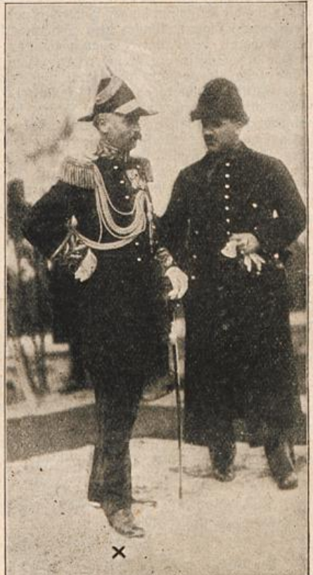
Der holländische Oberst Thompson †. (X) (Bei den Kämpfen um Durazzo gefallen.)

Handelsstadt mit vor- ... züglichen Hafenanla- ... gen. Die nach modern-