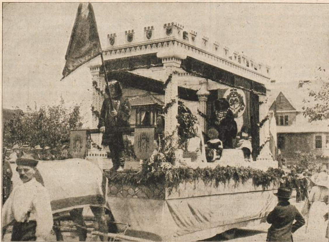
Vom Festzug anlässlich der Tausendjahrfeier des Luftkurortes Haiger in Hessen: König Heinrich III. als Herr des königlichen Gutshofes „Heigera“ um das Jahr 1048.

Durch Kompanie Ober ward unser leerer Dampfer zur Aufnahme von Santos rückfracht nach Santos dirigiert. Wir hatten auf dieser Fahrt hinsichtlich der tabellosen Witterungs- und Windverhältnisse ein gutes Glück, sonst hätte möglicherweise das „Spiel der Wellen“ dem widerstandlosen, leeren Kasten übel bekommen können. Im letzten Teil der dreitägigen Küstenfahrt belebte sich der bisher völlig ebene Horizont allmählich mehr und mehr durch das Hervortreten der Gebirgszüge der Sierra Geral und Sierra Paranaicaba. Je näher wir nach der Passage der Felseninsel Queimada Grande, dem Endziel Santos kamen, desto herrlicher bauten sich die 700 bis 800 Meter hohen Ausläufer der genannten Gebirgszüge allseitig hin.