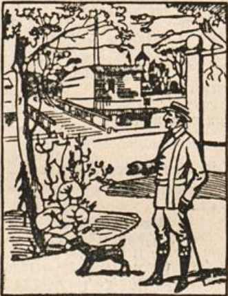
Wo ist der Begrüßte?