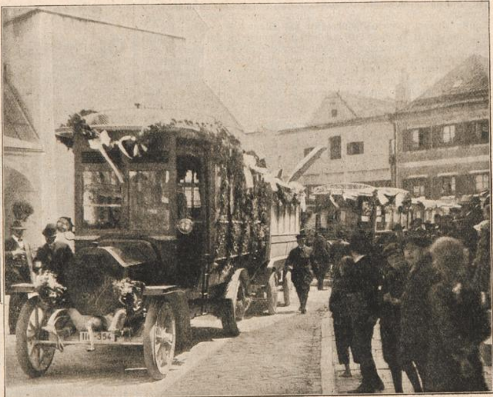
Von der Eröffnung der neuen Motorpostlinie Vilsbiburg-München: Der geschmückte Motorwagen.

... einer flachen Landzunge, welche in ... Schlinge umfahren werden ... Die so gebildete fjordartige Bucht ... eingeschlossen von vielgestalte- ... in lückenloser Fülle bedeckt.