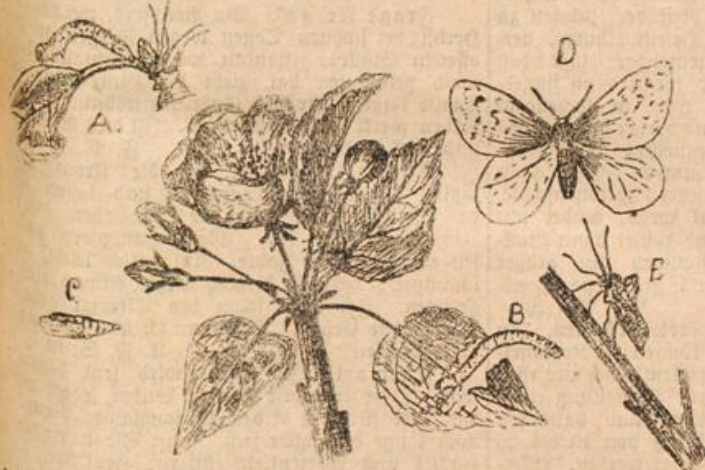
Abbildung 1. Der kleine Frostspanner. A junge Raupe während der Arbeit, B ausgewachsene Puppe, C Puppe, D Männchen, E Weibchen.

Aus der Reihe der tierischen Schädlinge, die wir im Anschluß an die Pilzschmarotzer zu behandeln gedachten, wollen wir heute zwei hervorheben, mit denen wir noch gerade zeitig genug kommen können, um ihnen etwas Gutes zu tun. Es sind der