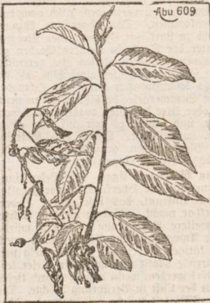
Polsterschimmel am Kirschbaum.

Der Polsterschimmel (s. Abb.). Monilia fructigena wurde zuerst nur am Obst beobachtet; in neuerer Zeit findet man ihn