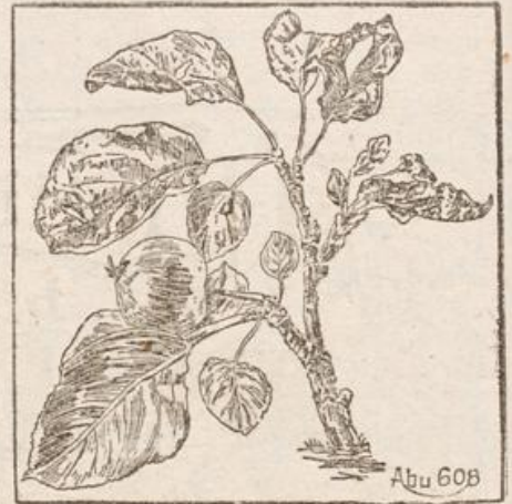
Durch Polsterschimmel abgestorbene Blüten, Blätter und Zweig des Apfels.

dann bestreue man ihn mit gebranntem Kalk. Ferner besprühe man im Ruhezustand des Holzes dieses mit ein- bis zweiprozentiger Kupfervitriolmischung. Was die Früchte anbelangt, so gibt es Jahre, in denen diese zu einem Drittel dem Pilz zum Opfer fallen. Sie erhalten große, braune Flecke, auf denen sich kreisförmig der weißlichgraue oder gelblichbraune Rasen des Schimmelpilzes anordnet. Sie trocknen auf den Bäumen ein und fallen im Herbst nicht ab. Auf dem Lager werden sie vom Pilz durchgefressen; dicht an gesunden Früchten liegende erkrankte stecken dieselben an. Abu.